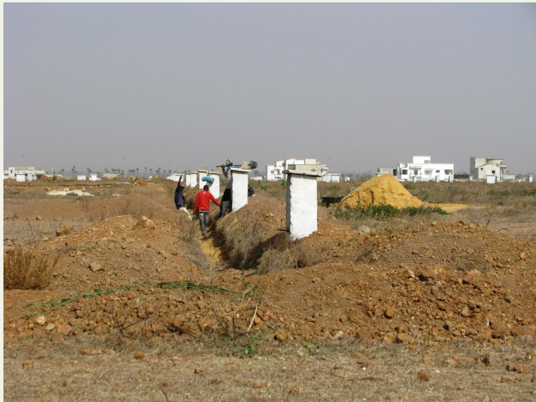
Pose de la première pierre du siège de l'Union régionale de Thiès en 2012