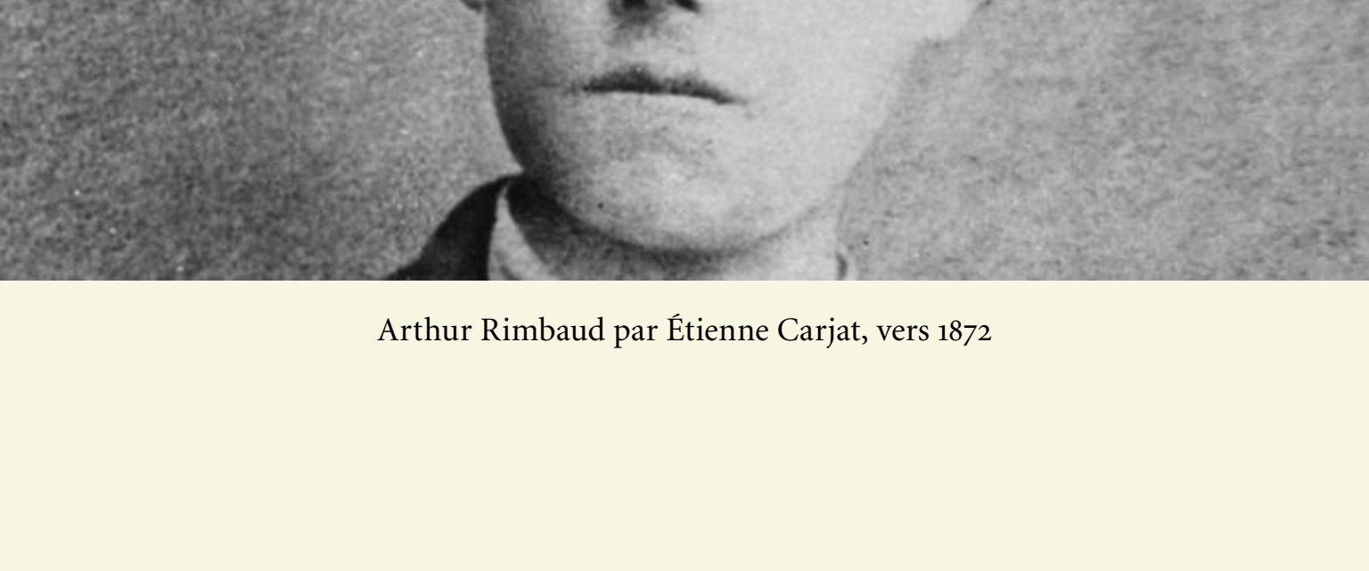
Arthur Rimbaud, vers 1872

JADIS, SI JE ME SOUVIENS BIEN , ma vie était un festin où s'ouvraient tous les cœurs, où tous les vins coulaient.