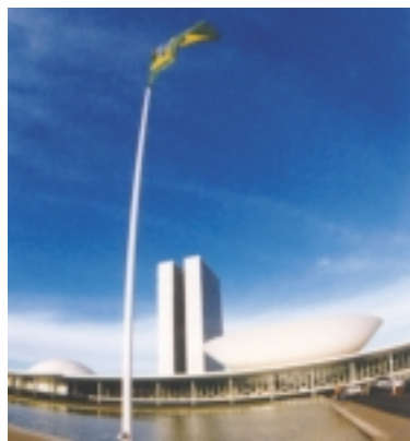
CONGRÈS NATIONAL DU BRÉSIL