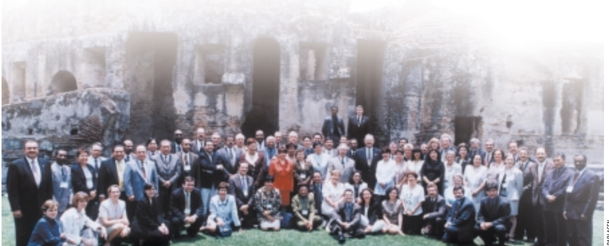
Réunion du Comité directeur de la COPA à La Antigua, Guatemala, du 6 au 9 mai 1999.