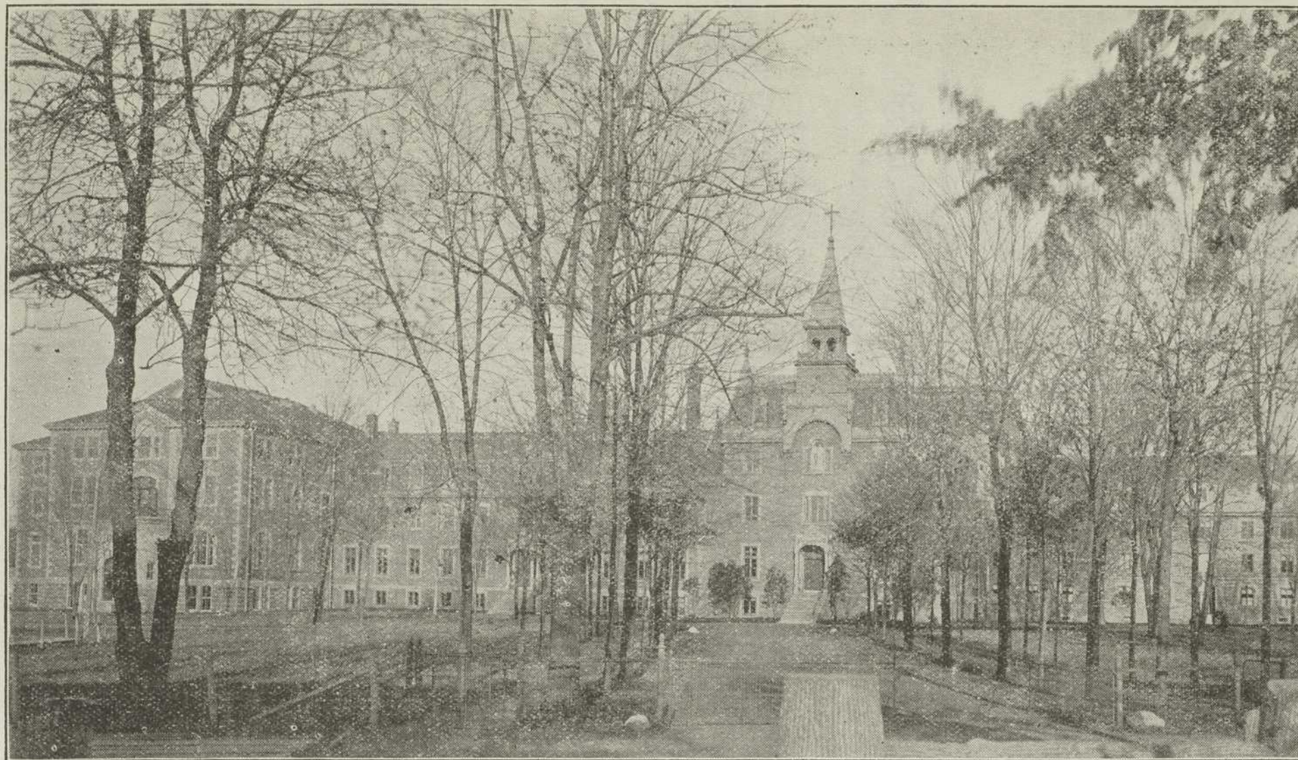
Le Pensionnat et la Maison-Mère des Soeurs de Sainte-Croix et des Sept-Douleurs, à Saint-Laurent, près Montréal