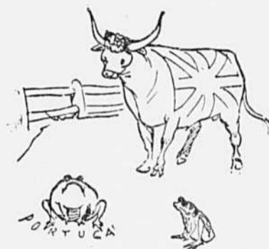
JOHN BULL ET LE PORTUGAL