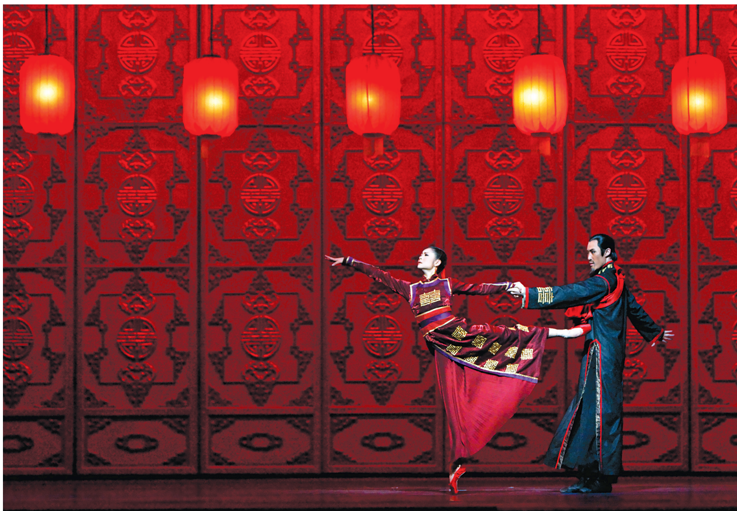
BALLET NATIONAL DE CHINE

Le ballet en trois actes a tourné dans une dizaine de pays depuis sa création. Il a connu une première mouture en 2000, plus axée sur la musique. Mais c'est la seconde version, créée l'année suivante, qui tourne à travers le monde. « Pour les chorégraphes, cette