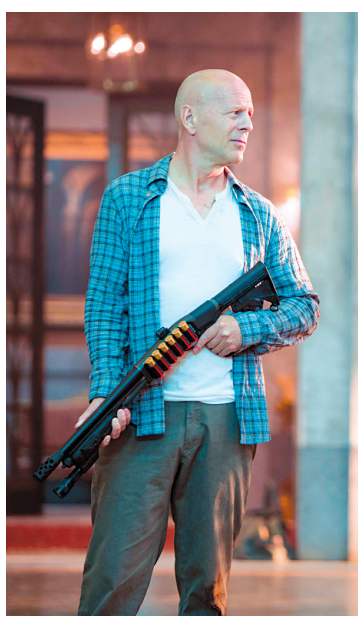
Bruce Willis reprend le rôle du policier John McLane.

Nostalgique des heures glorieuses de la guerre froide, l'action démarre avec un montage alterné confus: à Moscou, un haut fonctionnaire menace un prisonnier politique qui joue aux échecs dans sa cellule (attention: symbole); à Langley, la CIA