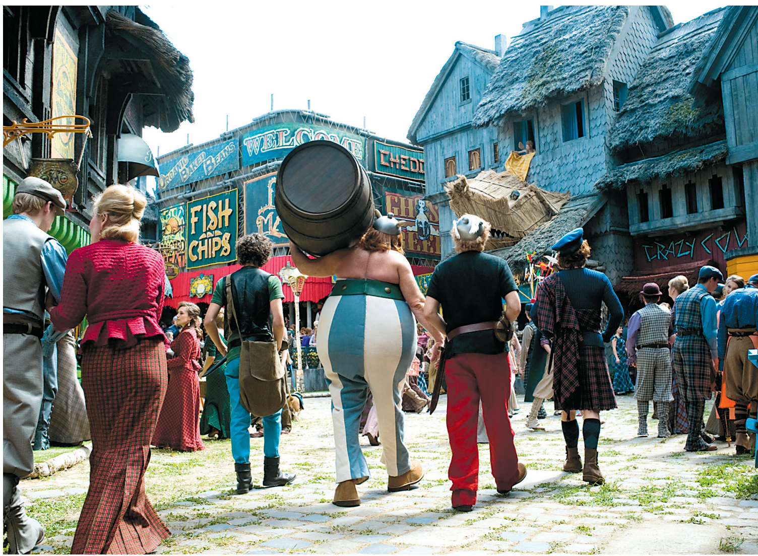
Tourné en partie à Malte, Astérix et Obélix au service de Sa Majesté met en scène dans leur village d'irréductibles les deux amis gaulois forcés de prendre en charge un jeune Lutécien paresseux et branché.

scénario: Astérix chez les Bretons , avec traversée de la Manche chez les Britanniques, et Astérix et les Normands , dans lequel des Barbares sans crainte veulent affronter la peur. Avec son scénariste Grégoire Vigneron, Tirard voulait montrer que chaque société barbare l'autre: les Anglais, les Romains, les Bretons, les Normands. « J'ai aimé l'épisode des Normands. Ils arrivent et repartent, donnant lieu à des scènes formidables, comme la parodie