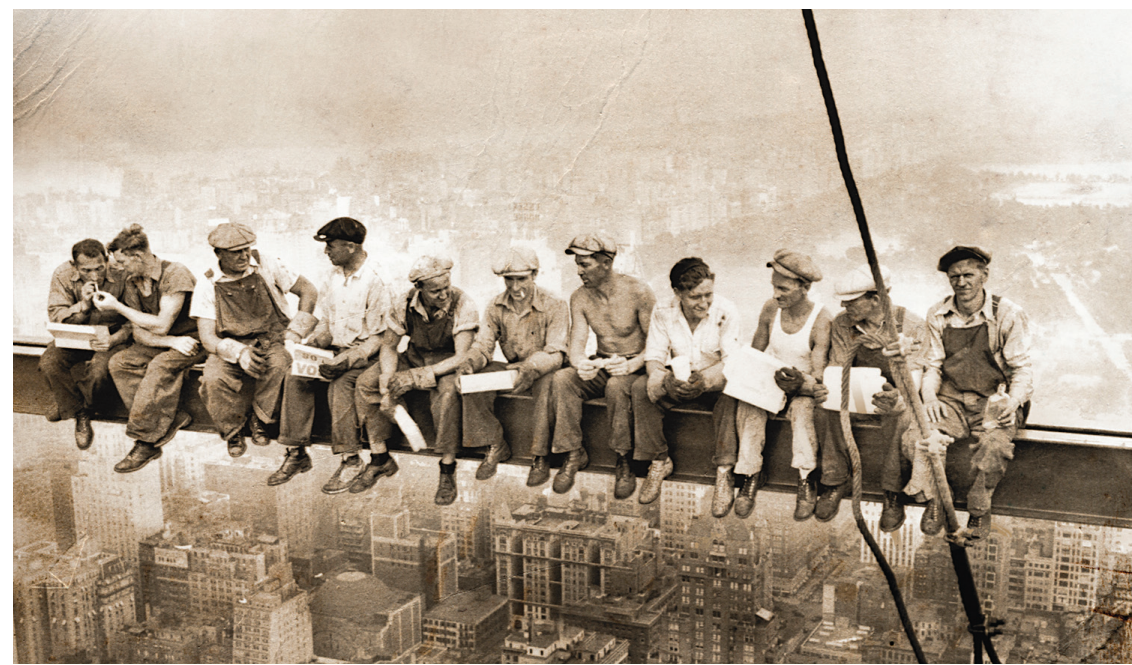
CINÉMA DU PARC

Retrouver la trace de l'auteur de ce fabuleux cliché, nommer ces héros anonymes et leur pays d'origine, voilà une tâche bien ardue à laquelle se livre le cinéaste, optant pour une approche soignée sur le plan esthétique, scrutant la photo sous tous ses angles. Cette exploration lève le voile sur les dessous moins glorieux d'une époque marquée par la misère et le chômage, où les immigrants irlandais, italiens et juifs s'entassaient par milliers dans les quartiers insalubres de la métropole américaine, consti-