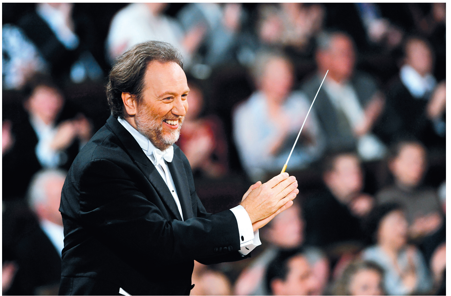
Riccardo Chailly incarne l'autorité musicale des festivités du bicentenaire de Verdi, en Italie.