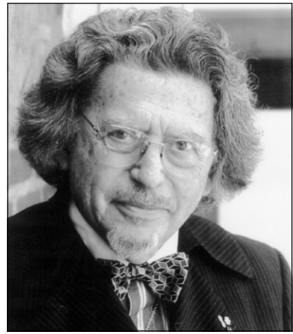
Mort le 1 er avril à 90 ans, Alexander Brott avait 80 ans lorsque cette photo fut prise.

L'Opéra de Montréal ne l'a pas encore annoncé, mais nous le savons déjà : Rinat Shaham remplacera Nora Gubisch dans le rôle-titre de Carmen , de Bizet, en mai et juin. Aux six représentations prévues, du 21 mai au 4 juin, s'ajoute une septième, le 6 juin.