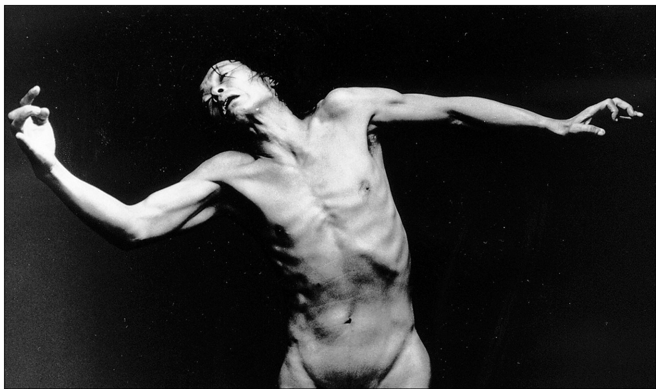
Min Tanaka, l'un des derniers maîtres butô vivants, a tracé sa cartographie personnelle, et, partout, il danse tel qu'il est : en homme libre.