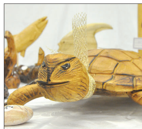
Une sculpture de Denise Collin.