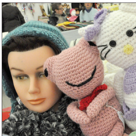
Les œuvres des Fermières.

Plusieurs artistes et artisans étaient au rendez-vous. Les voici, le vendredi soir, peu après l'ouverture du marché.