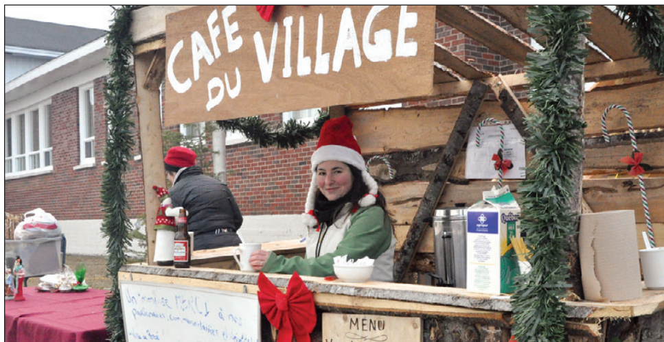
Le café culturel portera le nom de « Café du village. » Voici son kiosque lors de la fête.

Ariane AUBERT BONN • ariane.aubert-bonn@quebecormedia.com