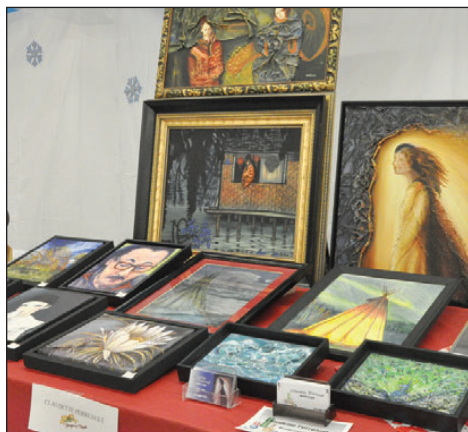
Les toiles de Claudette Perreault.