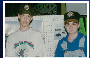
Photo souvenir Expo-science Fernand Séguin