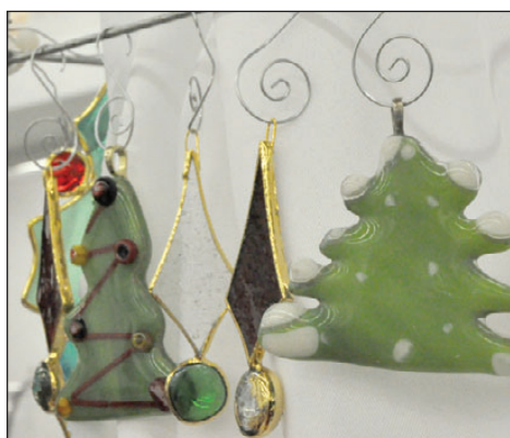
Les vitraux de Gilles Larose.