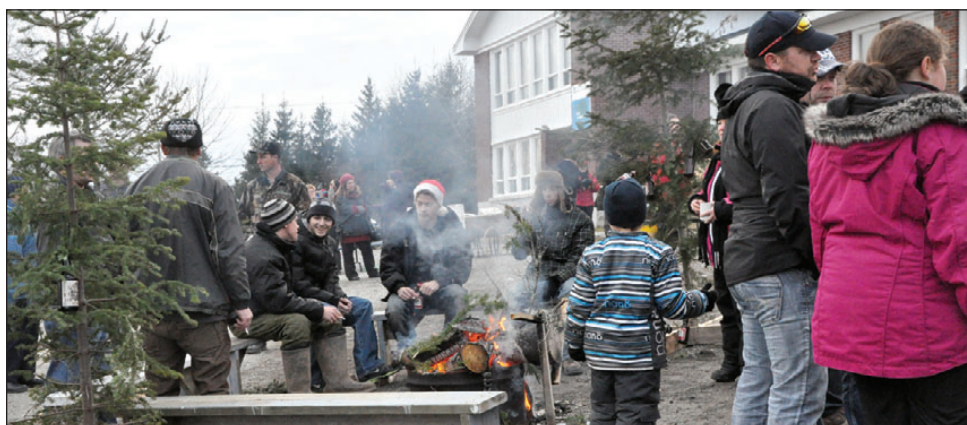
Les festifs réunis autour du feu.