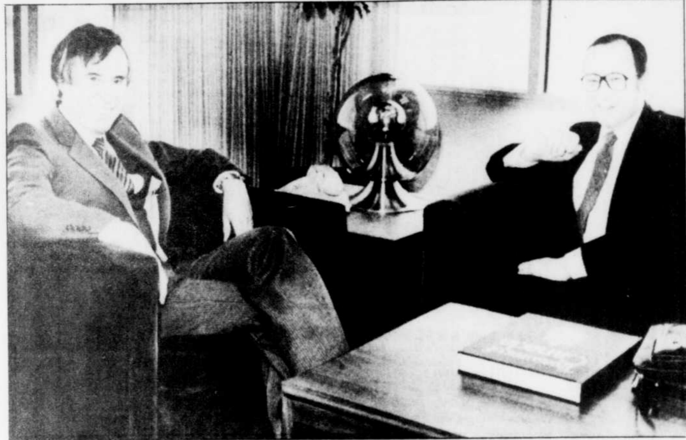
Le ministre canadien des Affaires étrangères, Mark MacGuigan, et son homologue suisse Pierre Aubert ont discuté, hier à Ottawa, de l'embargo décrété par le Canada sur ses livraisons d'uranium à la Suisse.

En Colombie-Britannique, M. Bill Bennett voit, lui, la popularité de son gouvernement du Crédit social tomber en vrille, surtout depuis que le coût du logement a connu un accroissement phénoménal à Vancouver.