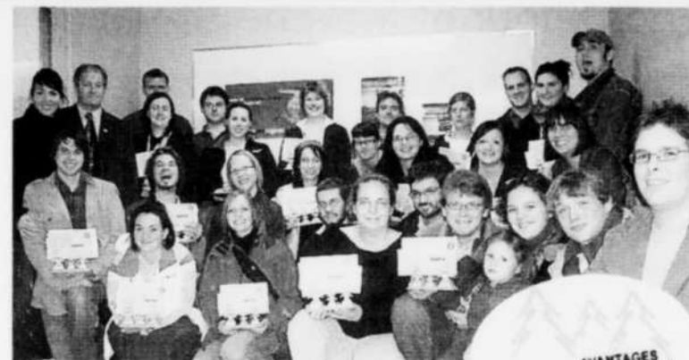
ACCUEIL - Remise de paniers d'accueil.

Près de cinq ans après la première entente spécifique régionale, de nombreux partenaires se sont joints aux initiateurs de la Stratégie afin de conclure une nouvelle entente pour les 5 pro-