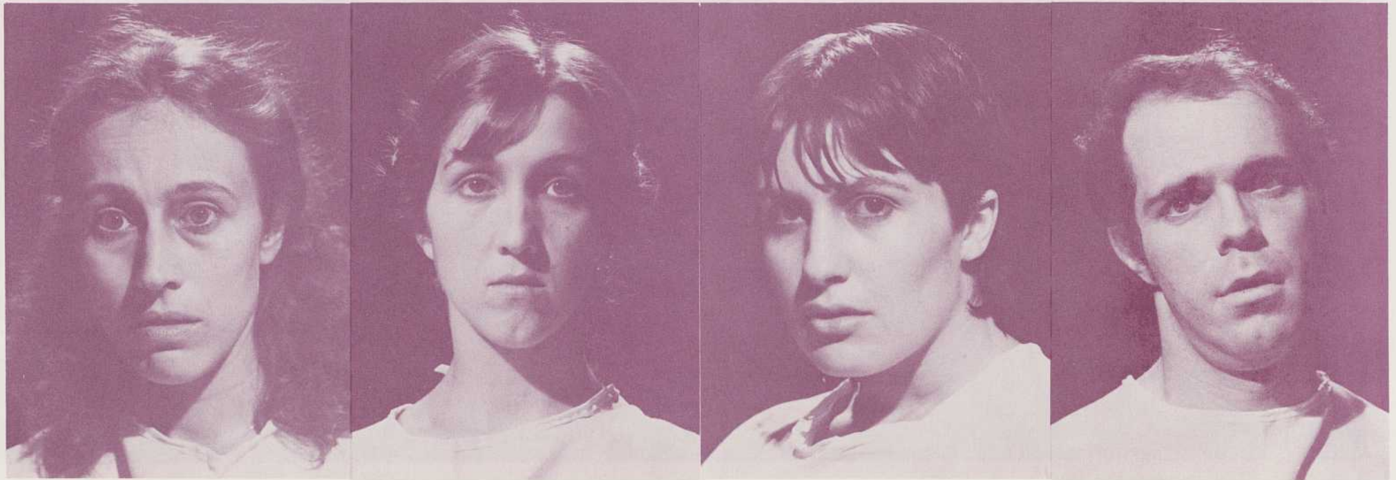
• LA FOLIE C'EST CE QUI RESTE APRÈS QU'ON A TOUT PERDU, SAUF LA RAISON • G.K. CHESTERTON