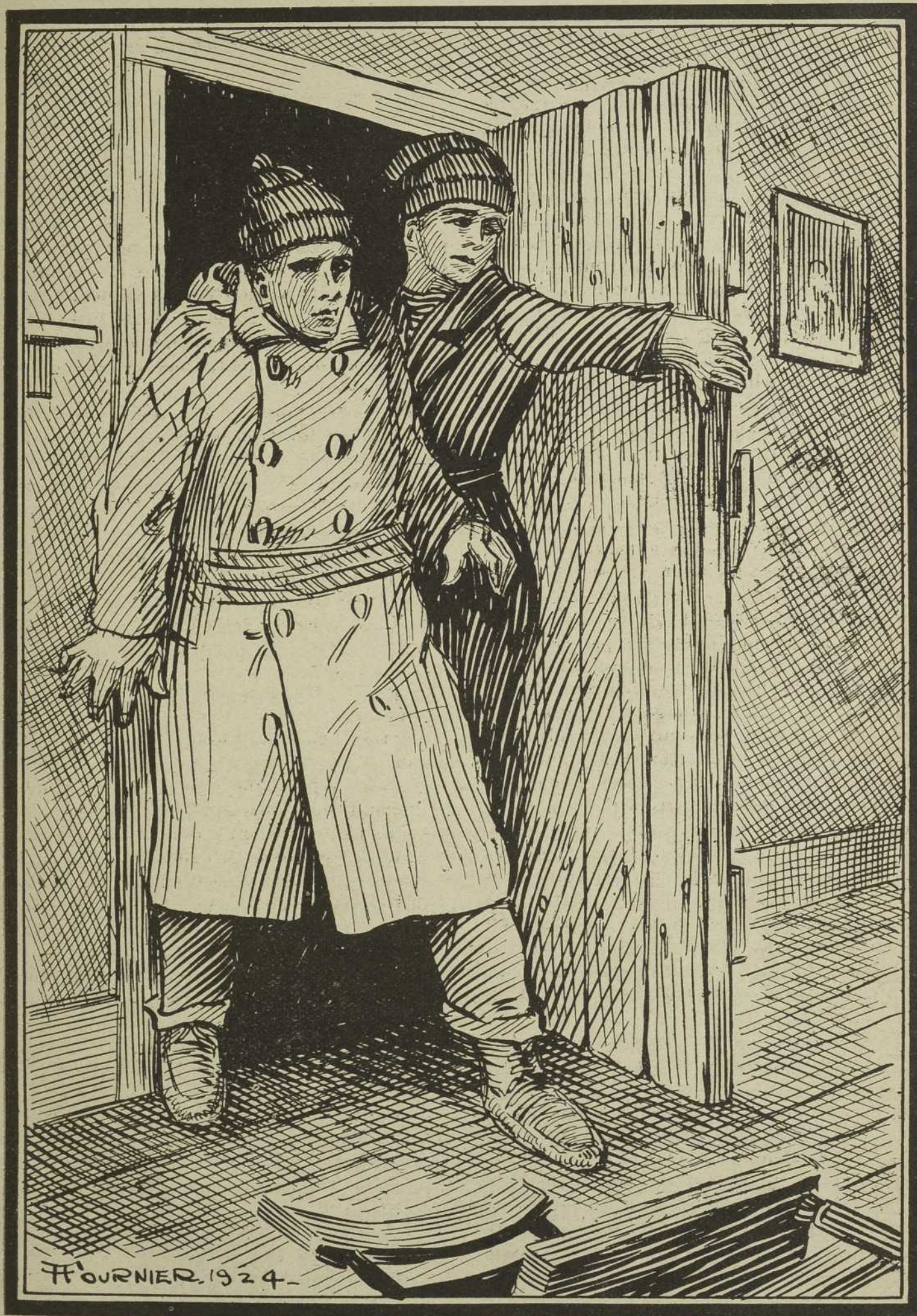
Ils trouvèrent la salle déserte... page 34.