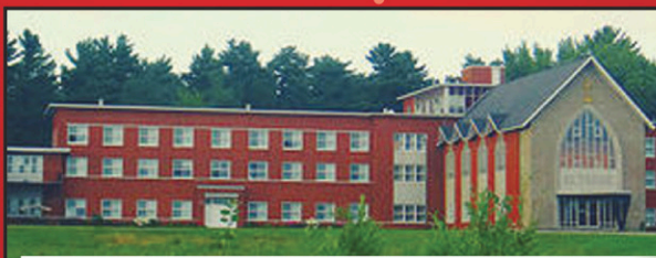
Résidence maison Béthanie 12 160, rue Notre-Dame-Ouest (Pointe-du-Lac) Trois-Rivières