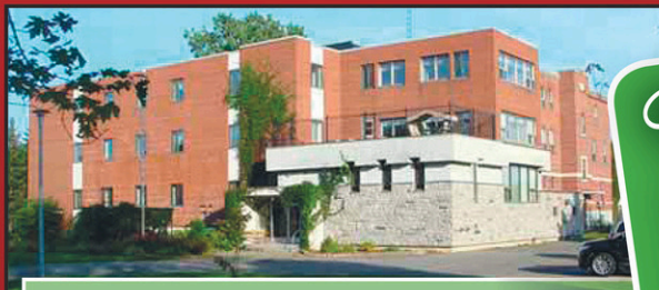
Résidence Yamachiche 610, rue Ste-Anne, Yamachiche