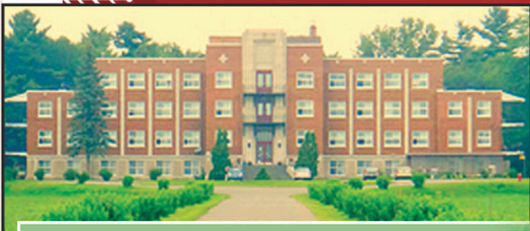
Résidence Cénacle St-Pierre 12 270, rue Notre-Dame-Ouest (Pointe-du-Lac) Trois-Rivières