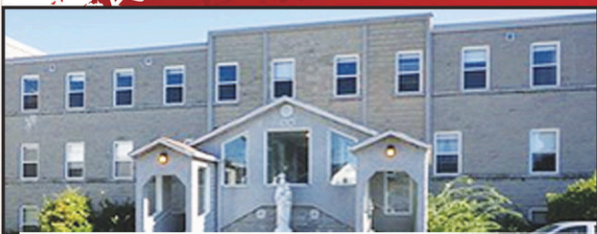
Résidence Notre-Dame 528, Notre-Dame (Cap) Trois-Rivières

Bonne et heureuse année à tous nos résidents, leurs familles et toute la population.