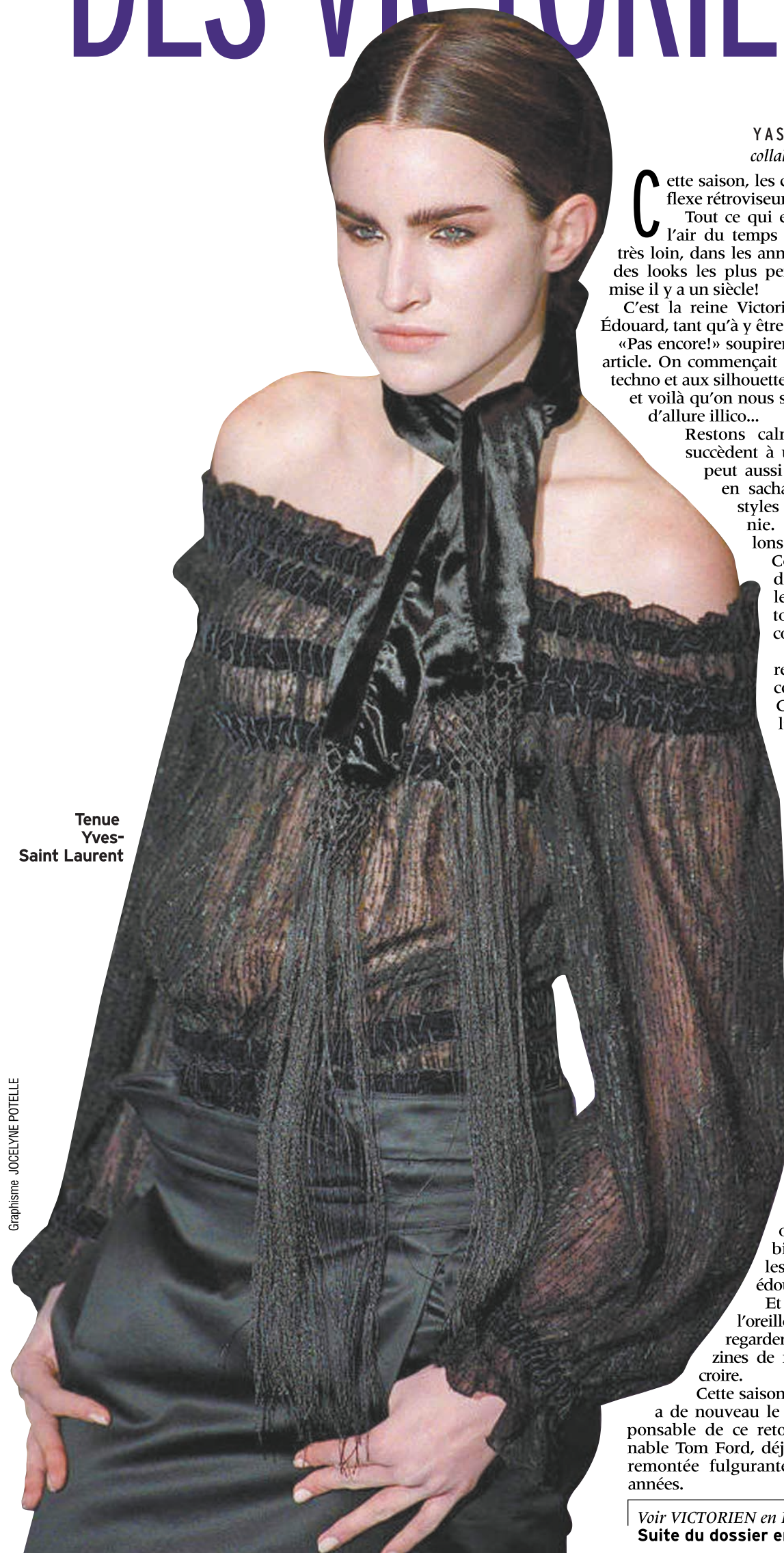
Tenue Yves- Saint Laurent