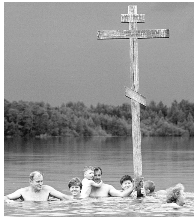
Une famille fait un pèlerinage traditionnel dans un lac, au sud-est de Saint-Petersbourg.