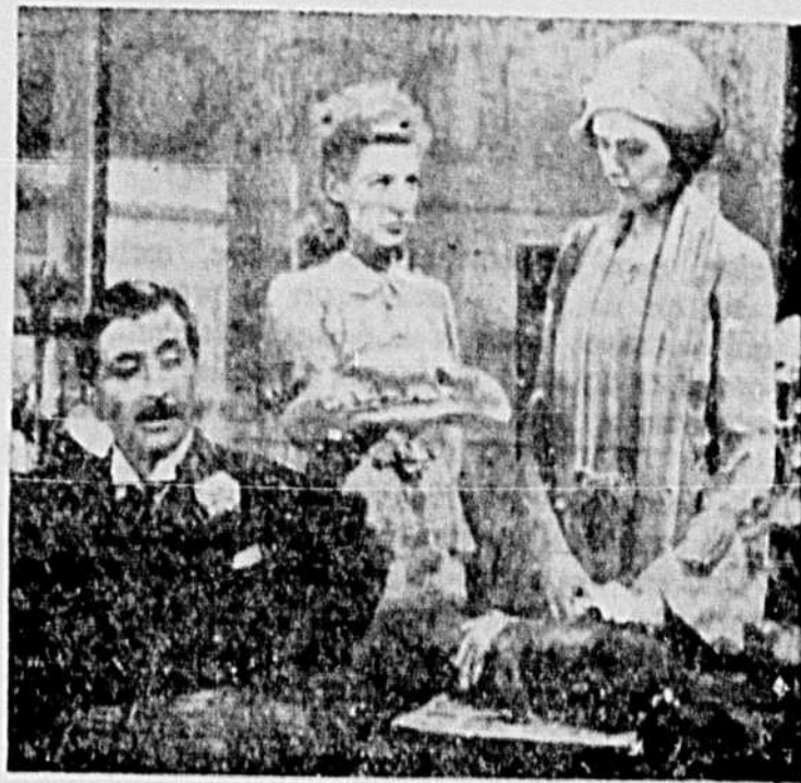
Une scène du film "THE HAPPY BREED", qui met en vedette Robert Newton, Celio Johnson et John Mills, au Palace.