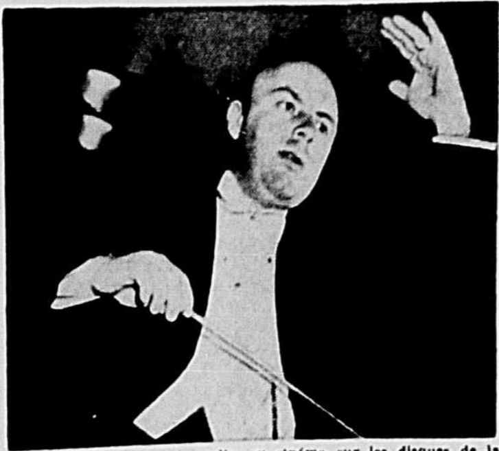
Qui n'a pas entendu à la radio, au cinéma sur les disques de la musique dirigée par ANDRÉ KOSTELANETZ. Ce prodigieux chef d'orchestre est renommé dans le monde entier pour ses arrangements d'orchestre et dirigé un orchestre de 80 musiciens le 19 juin au Stade Molson. Claire Gagnier sera la soliste.