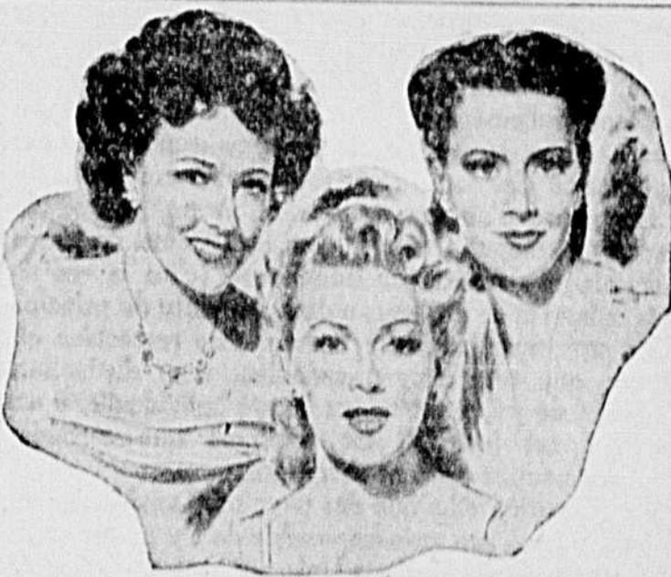
Laraine Day, Lana Turner et Susan Peters dans une scène de "KEEP YOUR POWDER DRY", que l'on verra au Capitol.