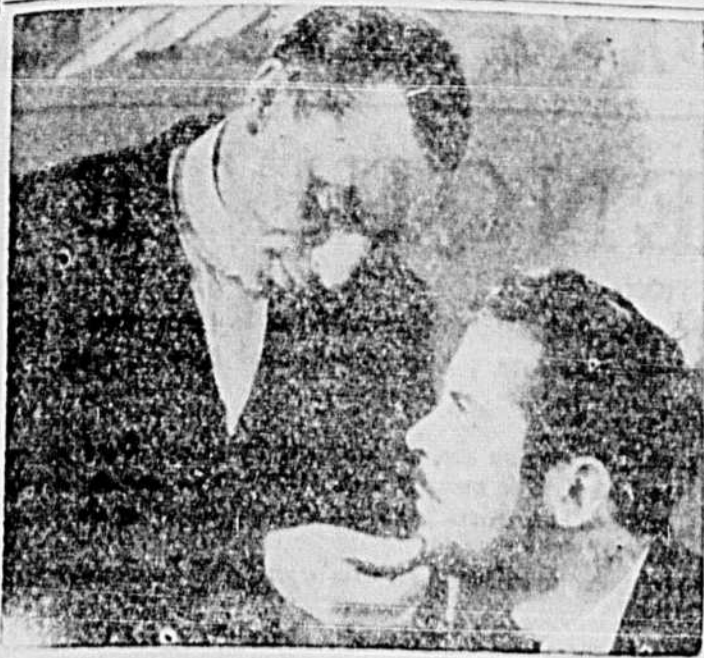
Le fameux artiste français Louis Jouvet et Fernand Gravy en vedette dans le film "MISTER FLOW", dès samedi à l'affiche du Saint-Denis.