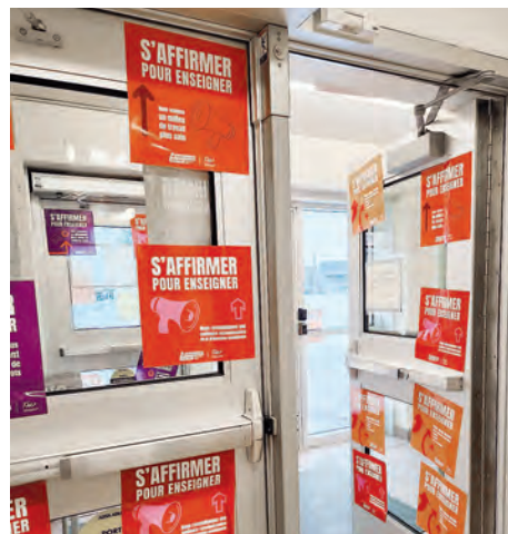
Le personnel de l'école du Harfang a placardé portes, murs et fenêtres de son établissement.

Les demandes s'orienteront principalement autour d'une conciliation plus facile entre le travail et la vie personnelle,