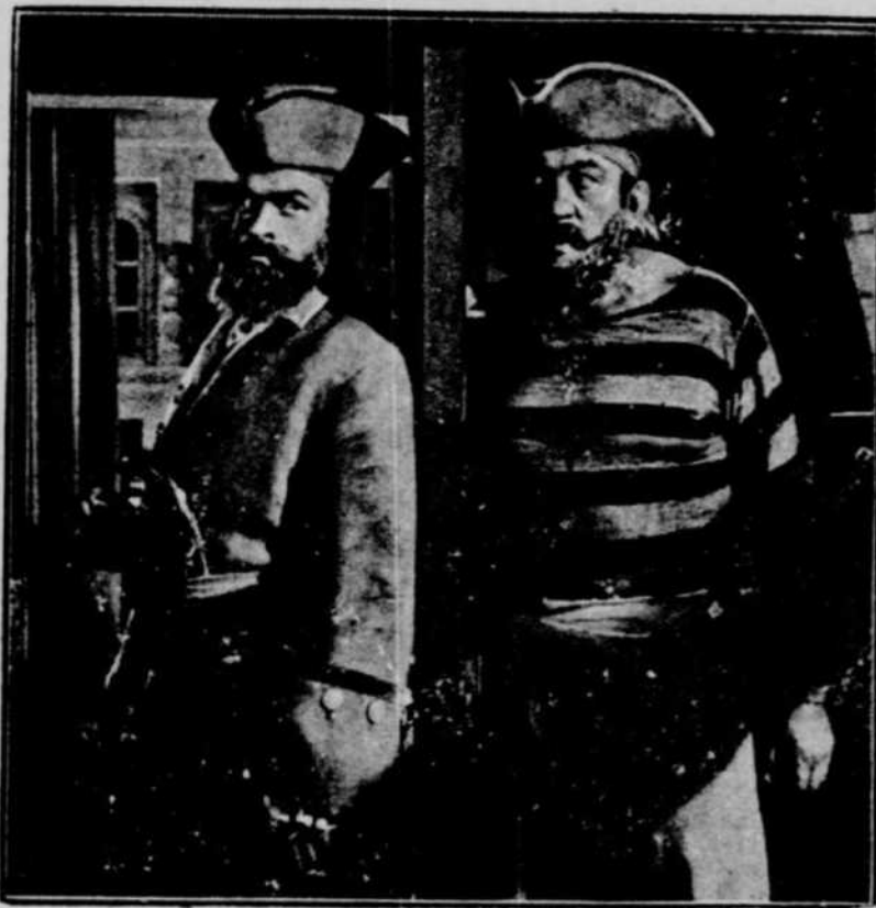
Bob Hope et Victor McLaglen dans une scène du film en COULEURS "The Princess and the Pirate", à l'affiche du théâtre Impérial pour 4 jours, les 4-5-6 et 7 février.