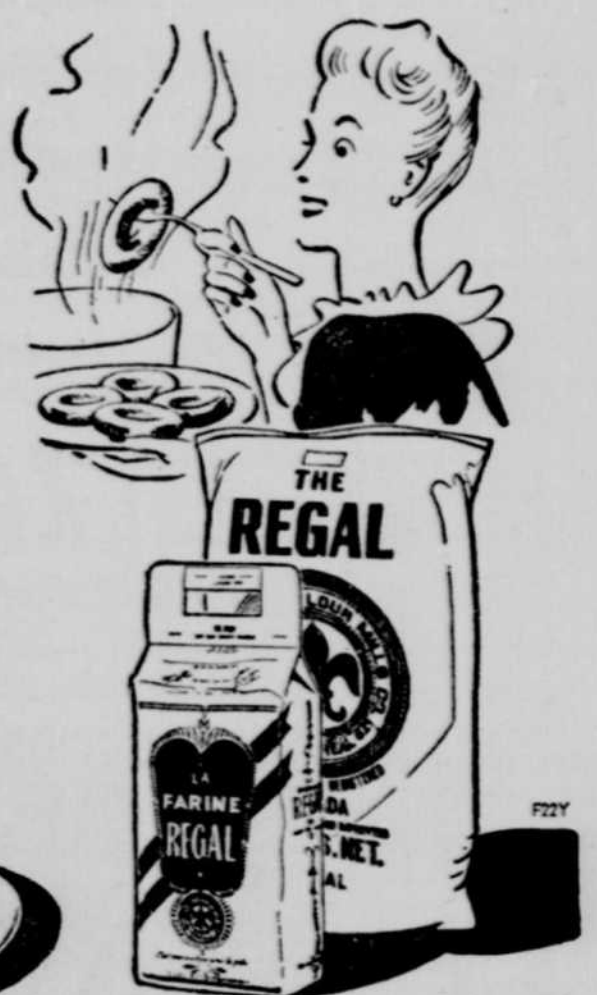
La Farine Regal se vend en sacs de 98, 49 et 24 livres et en sac pratique de 7 livres avec poignée

légère. Ajoutez l'oeuf, la muscade, et le reste de farine. Pétrissez, couvrez, et placez dans un endroit chaud pour faire lever. Puis abaissez au rouleau jusqu'à 1/4 pouce d'épaisseur sur une planche enfarinée. Coupez avec un coupe-beignes et laissez lever. Faites frire dans de la friture (360 degrés) jusqu'à ce que les beignes remontent à la surface et se retournent d'eux-mêmes — environ deux minutes. Egouttez sur du papier brun.