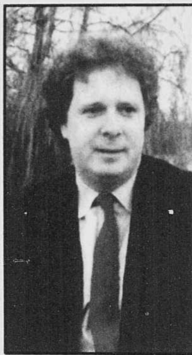
Jean Charest, ministre de l'Environnement du Canada

L'extra-territorialité du projet Grande-Baleine (notamment dans la baie d'Hudson), son impact sur les eaux navigables et sur la faune aqua-