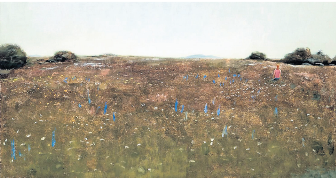
La prairie , de Jean-Paul Lemieux.