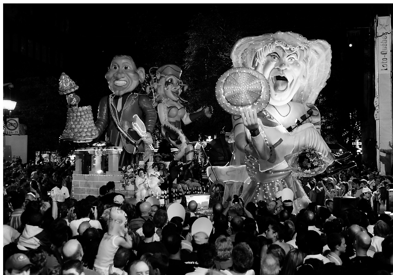
Le Grand Charivari deviendra un événement annuel. Sur notre photo, le défilé de l'été 2007, rue Saint-Denis, présenté dans le volet extérieur de Juste pour rire.

Programme: Osten (1988) et Süden (1989), ext. de Die Stücke der Windrose — Mauricio Kagel Du fouet et du plaisir (1997) — Denys Bouliane Sringara Chaconne (2008) (création) — Jonathan Harvey En moyenne et extrême raison (2009) (création) — Tristan Murail.