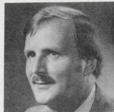
Président du comité Accueil invités d'honneur