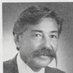
Président du comité général de Réception