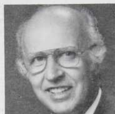
Président du comité Visites et voyages

Le 13 janvier 1982 à l'hôtel Méridien, le rendez-vous annuel de centaines de gens d'affaires intéressés à venir se saluer en compagnie du tout Montréal des affaires.