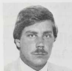
Président du comité Mise en marché