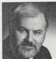
Président du comité Conférenciers

Toujours la tribune québécoise par excellence et maintenant l'une des plus courues au Canada tout entier, les mardis, à l'hôtel Sheraton Mont-Royal, à compter du 20 octobre '81 jusqu'au 4 mai '82.