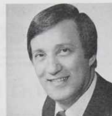
Président du comité Marketing Recrutement