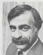
Président du comité Sports et loisirs

Seront privilégiés à nouveau les membres de la Chambre intéressés à assister à un spectacle de la nouvelle saison artistique montréalaise, ainsi qu'à une soirée spéciale dont le thème reste à déterminer. La journée de golf annuelle est prévue en août '82, plus de 250 participants sont attendus.