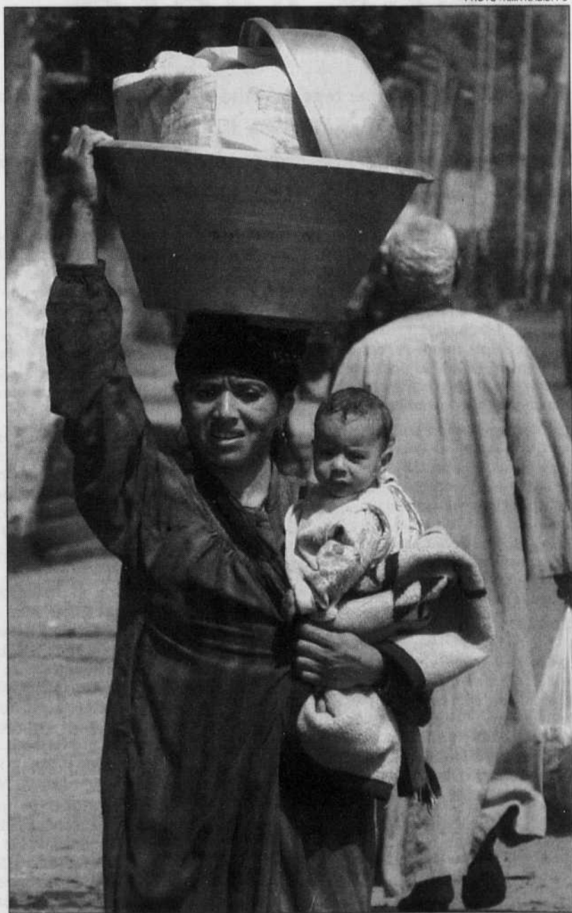
À Sakkara, à quelque 35 kilomètres dans la banlieue sud du Caire, la ville la plus peuplée du Moyen-Orient, avec ces 70 millions d'habitants.