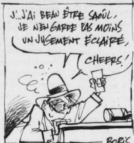
BORIS maui Reiser!