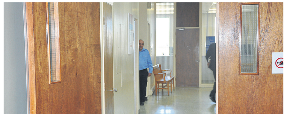
Sécurité Pro-Est embauche des agents de sécurité dans l'ensemble des palais de justice de la Gaspésie dont Sainte-Anne-des-Monts.

Puisque Sécurité Pro-Est n'a pas répondu favorablement à la décision du juge, des procédures de saisie seront enclenchées.