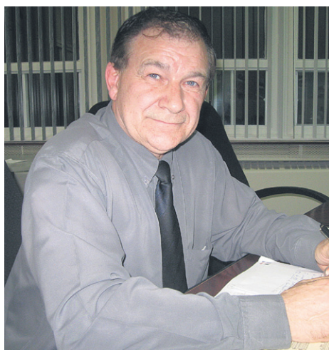
L'ancien maire de Port-Daniel-Gascons, Maurice Anglehart, se lance dans la campagne à la préfecture de Rocher-Percé.