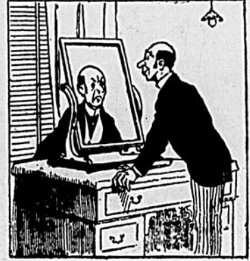
IV Antoine essaya de s'envoyer un sourire dans le miroir, mais resta tout ébahi en recevant une grimace.