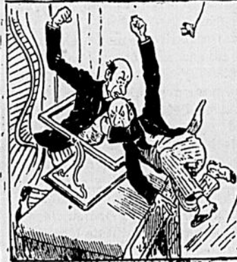
VII L'image riposta.