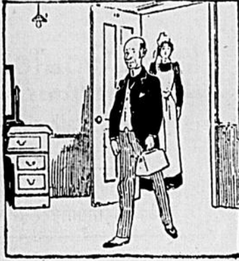
I A 10 heures Baptiste se fit conduire à sa chambre.