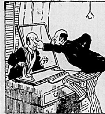
VI Ahuri, il lança une gifle à son image.