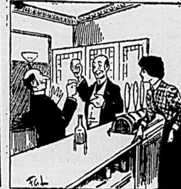
VIII Tout finit par s'arranger.