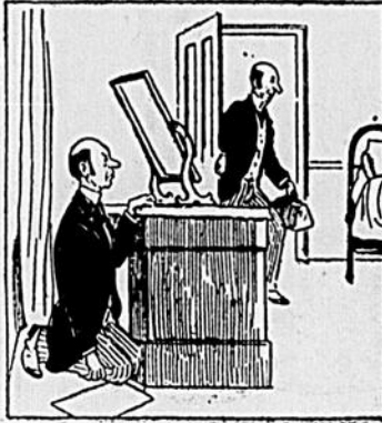
III Juste à ce moment Antoine qui ressemble beaucoup à Baptiste, entra par erreur dans cette même chambre