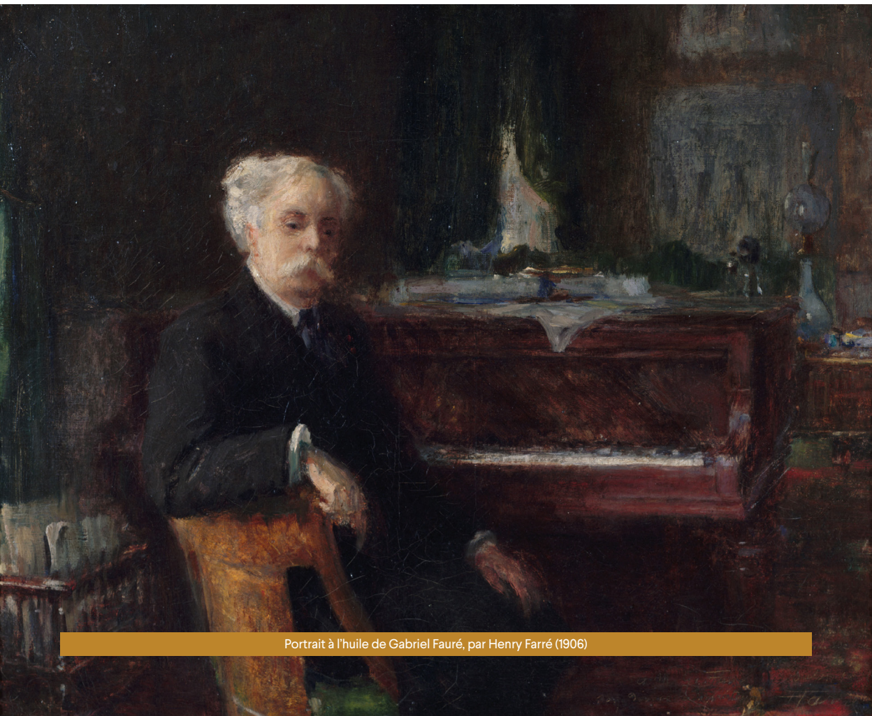
Portrait à l'huile de Gabriel Fauré, par Henry Farré (1906)