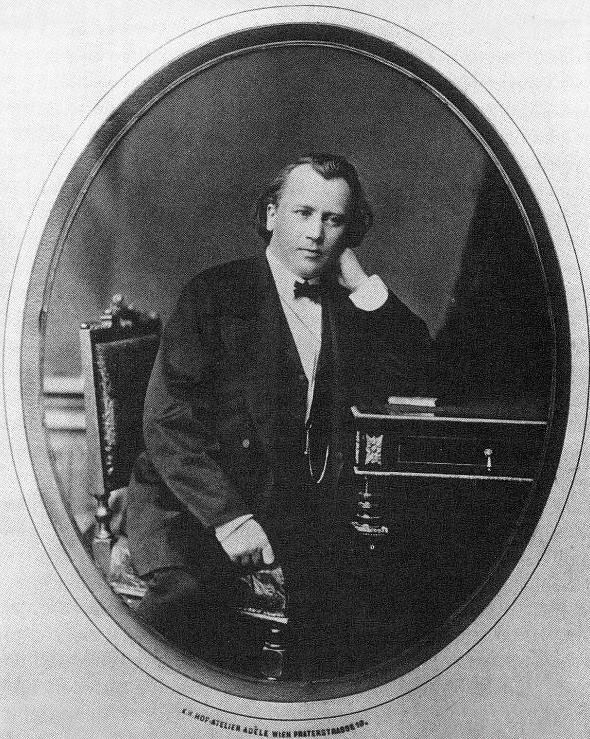
Portrait de Johannes Brahms, vers 1873 (auteur inconnu)