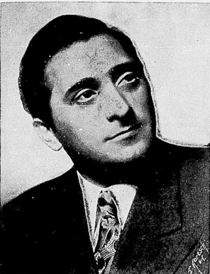
Jan Peerce, ténor, que la Société Artistique présente à l'auditorium de l'Université ce soir. Il reste d'excellents billets à $1.50 et $1.25 que l'on se procure à l'A.G.E.U.M. ou ce soir à la porte.