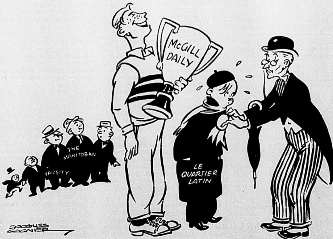
McGill gagna la coupe, mais le Quartier latin fut décoré: "... for its literary achievement and artistic style."