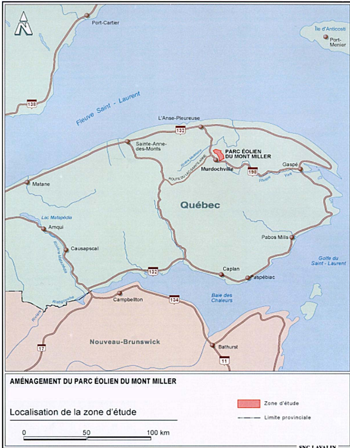
FIGURE 1 : AMÉNAGEMENT DU PARC ÉOLIEN DU MONT MILLER