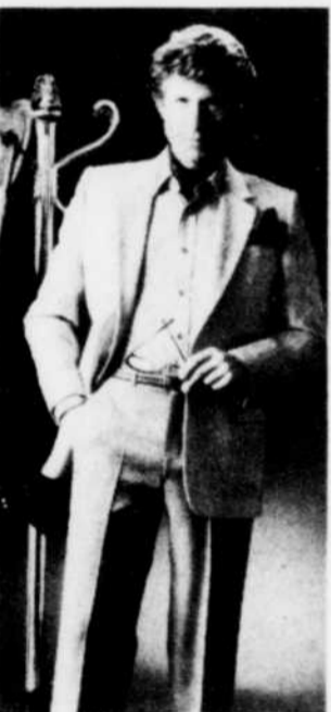
"Le luxe dépouillé d'une veste minutieusement taillée dans ce velours côtelé de pure soie."

ment l'épitomé de toute sa philosophie vestimentaire, dans son édition de l'automne 80. Ce fameux designer au rayonnement international insiste désormais sur la minceur de la silhouette, l'allure élancée et active qui accrochent tellement bien au style de la vie que nous connaissons.