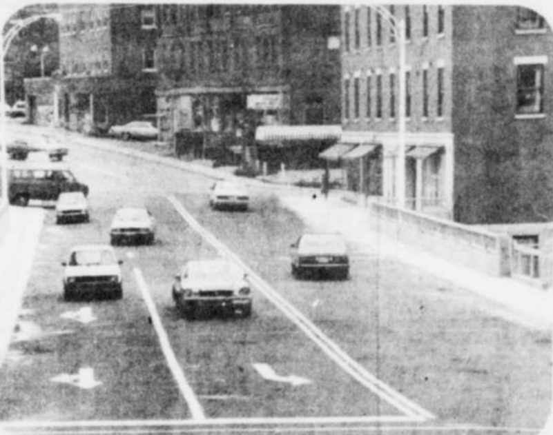
Le pont Dufferin a été rouvert officiellement hier. Les travaux de réfection du pont auront duré près de six mois. La firme Dorilas Grenier a obtenu le contrat de ces travaux, qui ont coûté quelque $850.000, dont $175.000 ont été défrayés par le gouvernement québécois.