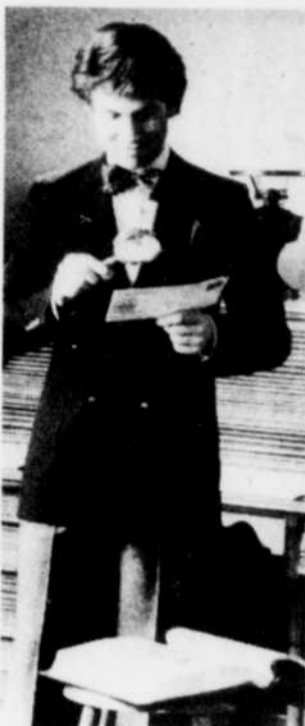
"L'inéluctable de la mode: le blazer de toutes les situations, taillé dans une pure flanelle de laine."

La collection de Londres de Hardy Amies est vraie-