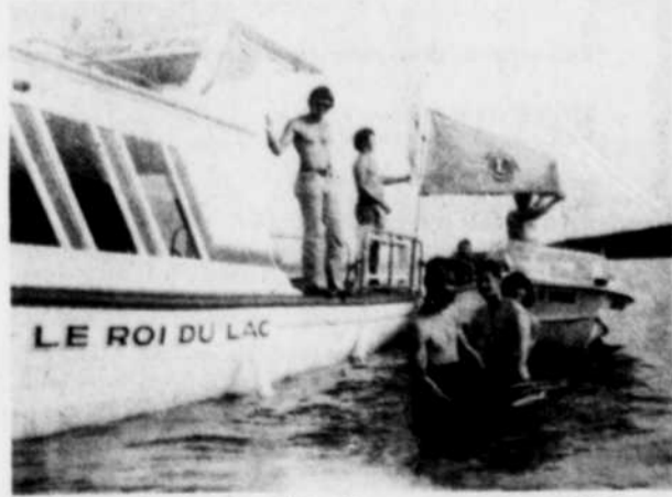
Le Roi du Lac a été d'une grande utilité au cours de la campagne de nettoyage du lac Mégantic entreprise par les membres d'un club de plongée sous-marine de l'endroit.