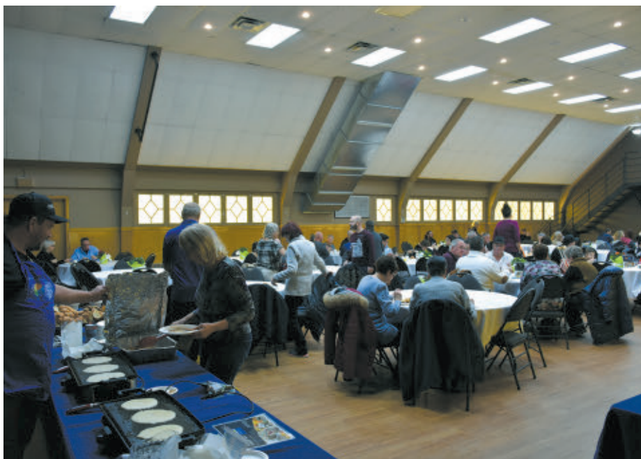
Le conseil municipal tiendra son traditionnel brunch-bénéfice à la salle du centre de loisirs Notre-Dame-de-Toute-Joies le dimanche 25 janvier prochain de 9 h 30 à midi.

Richard Lefebvre rlefebvre.journal@gmail.com