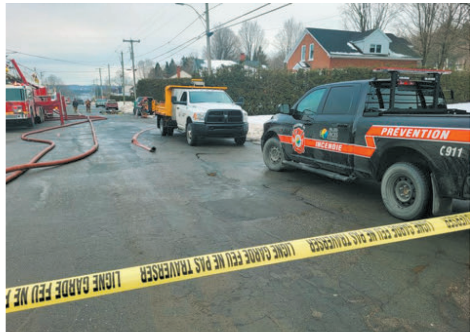
Au total ce sont plus de 103 interventions directes et indirectes sur lesquels les pompiers de Val-des-Sources auront œuvré en 2025.

moins de 700 visites qui ont été réalisées en 2025 et un nombre similaire est prévu pour 2026.