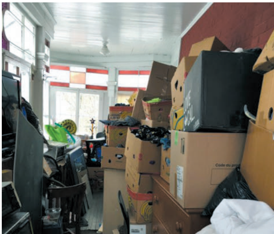
Les Trésors du partage sont une friperie dont l'argent recueilli sert à l'entretien de l'église Sainte-Bibiane. Et c'est à cet endroit qu'a convergé l'aide aux sinistrés.