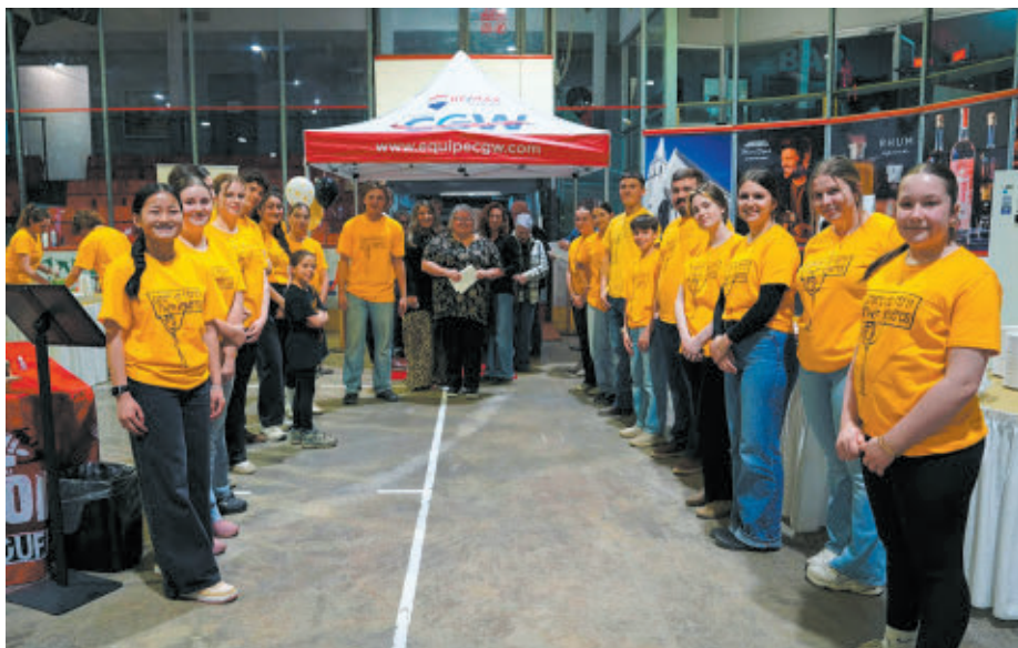
L'équipe du Centre de répit Théo Vallières.

Des billets pour les tirages sont disponibles au Journal Actualités-L'Étincelle. Ils doivent être payés en argent. Pour les virements Interac (centre.theovallieres@hotmail.com), la question : Ville du centre. Et la réponse : Windsor.