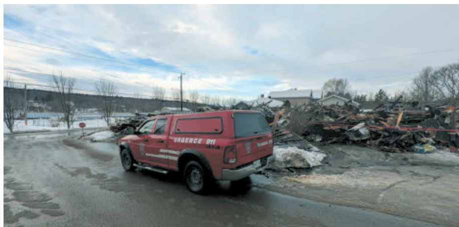
C'est ce qu'il reste de l'immeuble de 11 Logements sur la rue King à Richmond