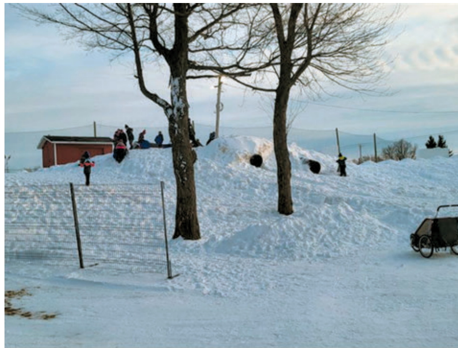
Le site du parc Dollard s'animera une fois de plus le 31 janvier prochain, alors que la Ville de Val-des-Sources tiendra sa fête carnavalesque de la saison avec la présentation de L'Hivernale.

En outre, les gens pourront se réchauffer avec une tasse de chocolat chaud et déguster des collations, des bières et d'autres boissons dans les kiosques installés à cette occasion. Cette journée s'annonce être très amusante pour les enfants et les adultes.