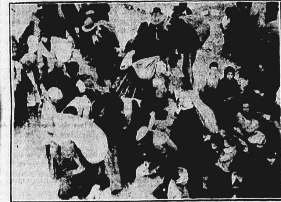
La fuite des civils devant les troupes maures du général Franco.

La Révolution a changé tout cela : les feudataires et autres "grands d'Espagne", ayant eu la sagesse de prendre la fuite au moment opportun, ont déserté leurs somptueux "castillos" et inquiets, hantent les palais d'Europe ou les Quartiers Généraux de Salamanque et de Burgos, et la terre appartient maintenant à ceux qui l'aimaient et la travaillaient.