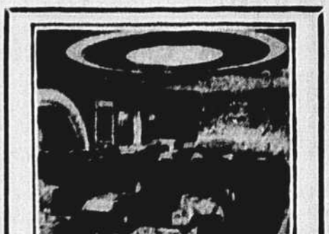
Goutez la gaieté et brillante revue présentée deux fois chaque soir et au lunch-dansant du samedi après-midi.