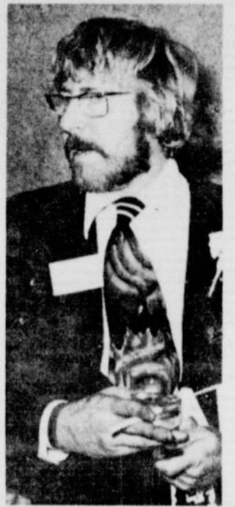
TEX se couchera désormais plus tôt puisque, à tous les matins, il devra être en ondes à cinq heures.