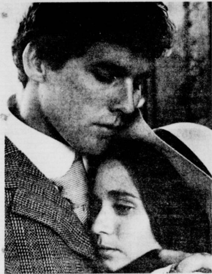
«Johnny s'en va-t-en guerre»:

Gagnant de trois prix lors du dernier festival de Cannes, Grand Prix du festival d'Atlanta et aussi le trophée de la «Colombe d'or», «Johnny s'en va-t-en guerre» (Johnny Got His Gun) prend l'affiche cette semaine du cinéma Vendôme.