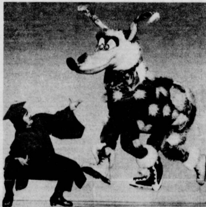
Le professeur Teawinkle a de la difficulté avec ses cours puisque son élève semble tout droit sorti de « Sesame Street », un programme que tous les enfants suivent à la télévision. C'est aussi un numéro adapté des Ices Follies, au Forum du 1 er au 7 février.