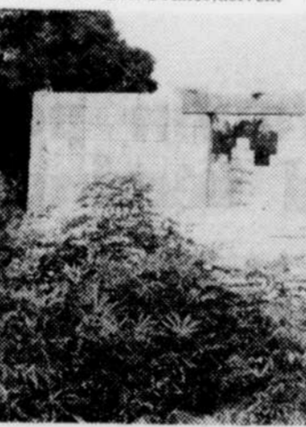
UNE ECOLE A FLON — Grâce aux profits du rallye Tiers-Monde de Victoriaville et au travail des stagiaires des Bois-Francs en Haïti, on est à réaliser une école primaire à Flon dans ce pays. On voit ici un aperçu des travaux effectués et devant être terminés prochainement.