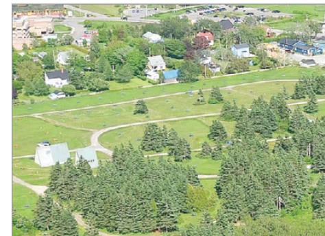
L'immense terrain de camping au centre du village peut facilement recevoir d'autres usages complémentaires.

Dans ce contexte d'élections municipales, la coopérative interpelle l'ensemble des candidats et les invite à décrire les gestes concrets qu'ils comptent poser afin de renforcer les partenariats et la cohésion de la principale industrie de la municipalité.