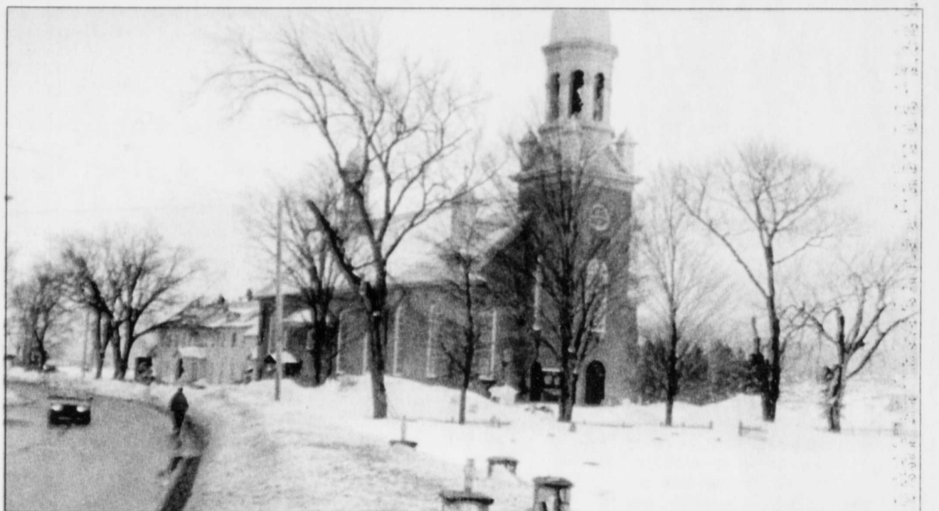
L'église et le presbytère de Sainte-Anne-de-Ristigouche.