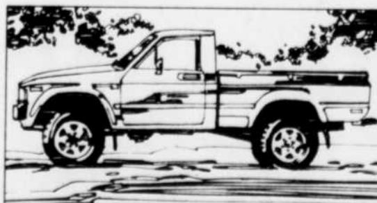
La camionnette sport SR5 à 4 roues motrices

TOYOTA. Les camionnettes... ça nous connaît. Passez voir les camionnettes Toyota dès maintenant. Et faites vite, le nombre étant limité pour certains modèles 1983.