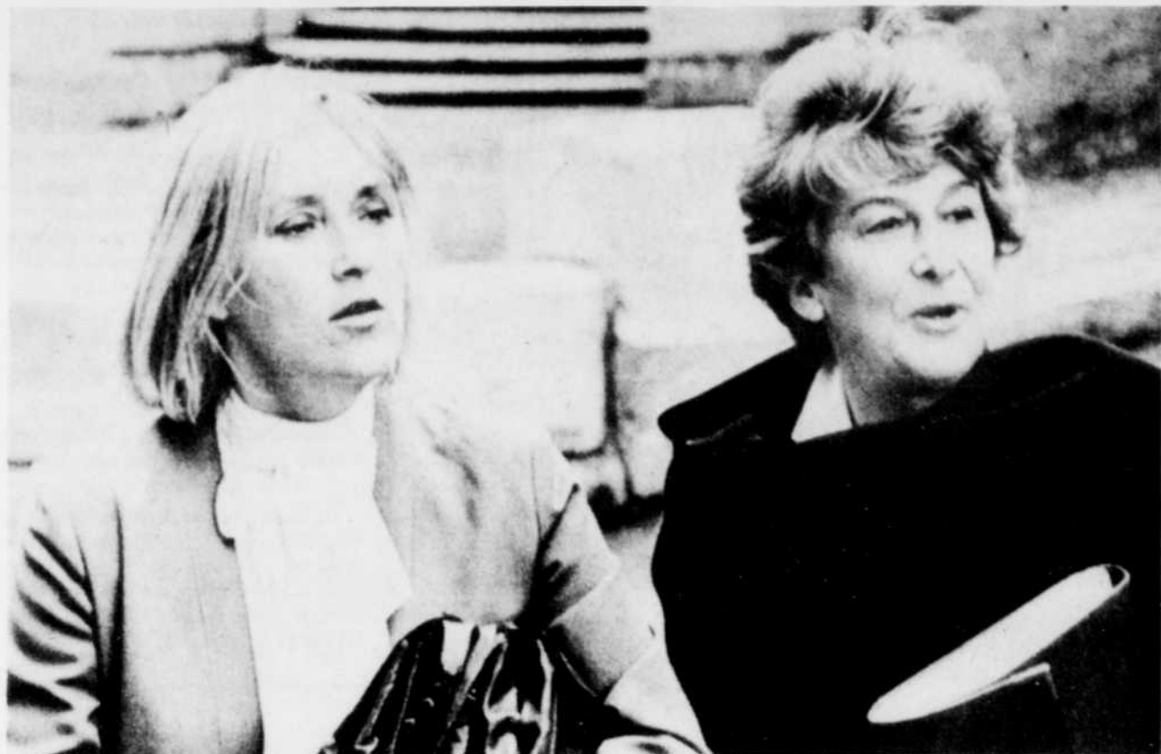
Mme Pauline Marois, ministre déléguée à la Condition féminine, s'est entretenue hier avec la ministre française des droits de la femme,