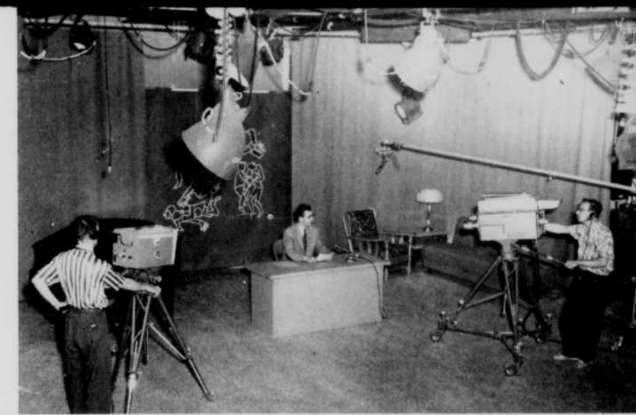
"Tous les amants se ressemblent..." dit la chanson et il en va de même pour les studios de télévision. L'équipement de base se résume à une perche de son, des caméras, des projecteurs... Lors d'une réalisation, ce décor s'anime, des personnages prennent vie et deviennent présents à leur public.

Mais il y a aussi les amateurs de musique classique et d'art à qui on offre un Récital et une demi-heure hebdomadaire animée par les membres du Centre d'art mauricien; il y a également Points cardinaux , où un