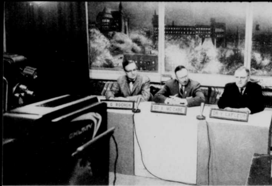
Le Courrier de... émission réalisée dans les studios de CHLT-TV, apporte chaque semaine des conseils judicieux aux téléspectateurs.