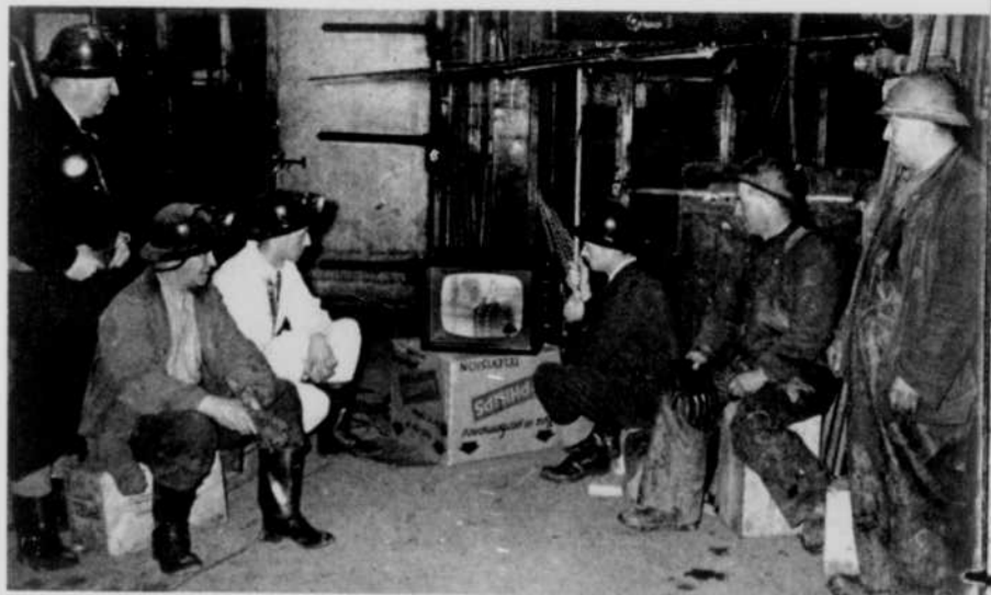
Ces employés de la mine d'or Hollinger jouissent, à 200 pieds sous terre, d'une réception parfaite, au poste CFCL-TV de Timmins. La légende veut que même les "commerciaux" ne leur échappent pas à travers 200 pieds de roc.

CBWT relaie, en différé, quelques-unes des principales émissions du réseau français, au prorata du pourcentage de la population de langue française.