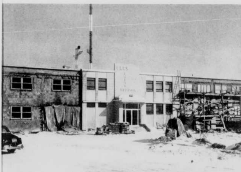
Le poste CKRS bénéficiera dans quelques mois de nouveaux studios et autres locaux. Notre photo donne un aperçu des travaux de construction qui devraient être complétés le 1er avril prochain.

La croissance rapide du poste de télévision de Jonquière est due à la fois à la clairvoyance de la direction, à la confiance des commanditaires et, dans une large part, à l'intérêt et à la compréhension du public, dont l'élément français s'établit à 95%.