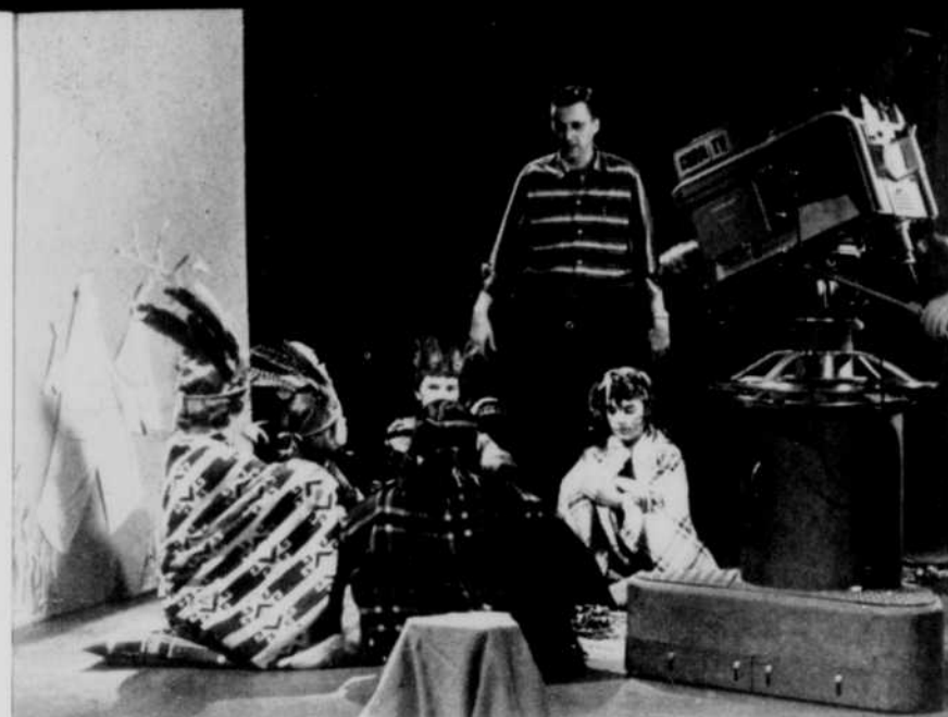
Au cours d'une répétition de l'émission Nos artistes en herbe , le directeur technique de CKRN-TV prodigue quelques conseils aux jeunes comédiens et règle les derniers détails du spectacle.

En effet, jusqu'à ce jour, en dehors des émissions locales et de la projection de films, le poste était alimenté, si l'on peut dire, par des kinescopes ou enregistrements sur film de diverses émissions réalisées à CBFT. Ces kinescopes étaient présentés sur les écrans de télévision de la région du Saguenay, deux semaines après leur enregistrement à Montréal. Ce délai n'influençait pas sur la qualité ou l'intérêt de l'émission, tant qu'il ne s'agissait pas de reportage. Dans ce dernier cas, le kinescope perdait beaucoup de sa valeur. Aussi, la liaison de Jonquière au réseau micro-ondes provoqua-t-elle une grande joie dans tous les foyers où pénètre CKRS-TV.