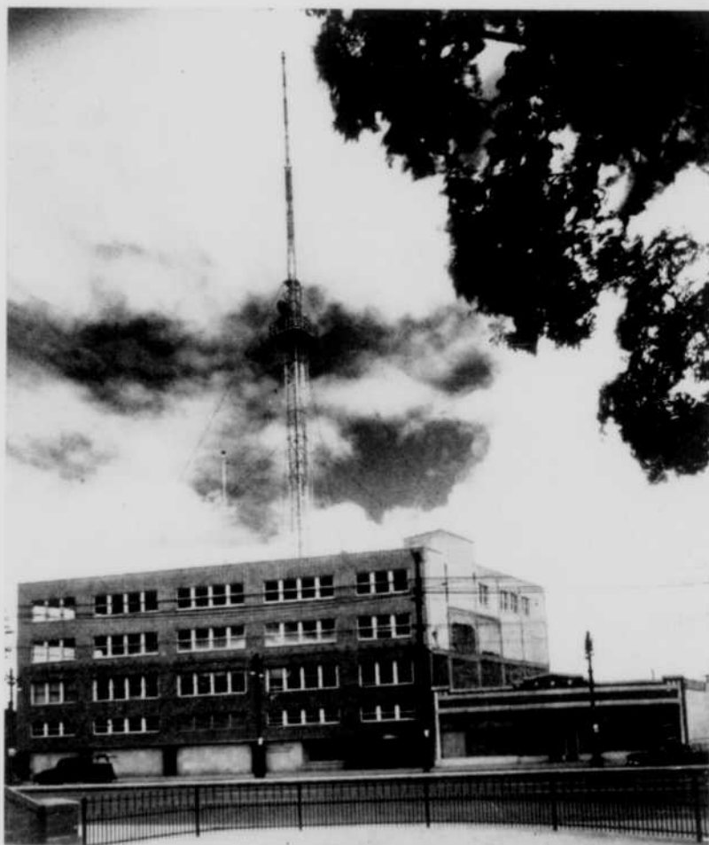
JUSQU'À WINNIPEG. — Certaines émissions du réseau français sont présentées à la population de l'Ouest canadien par l'entremise du poste CBWT de Winnipeg, dont on aperçoit ci-haut l'édifice et l'antenne. CBWT transmet ces émissions au moyen de kineoscopes qu'il reçoit de CBFT.

La dislocation de l'horaire régulier que les circonstances ont amenée ces dernières semaines a démontré hors de tout doute le rôle de premier plan que le réseau de Radio-Canada joue au sein de la population de langue française.