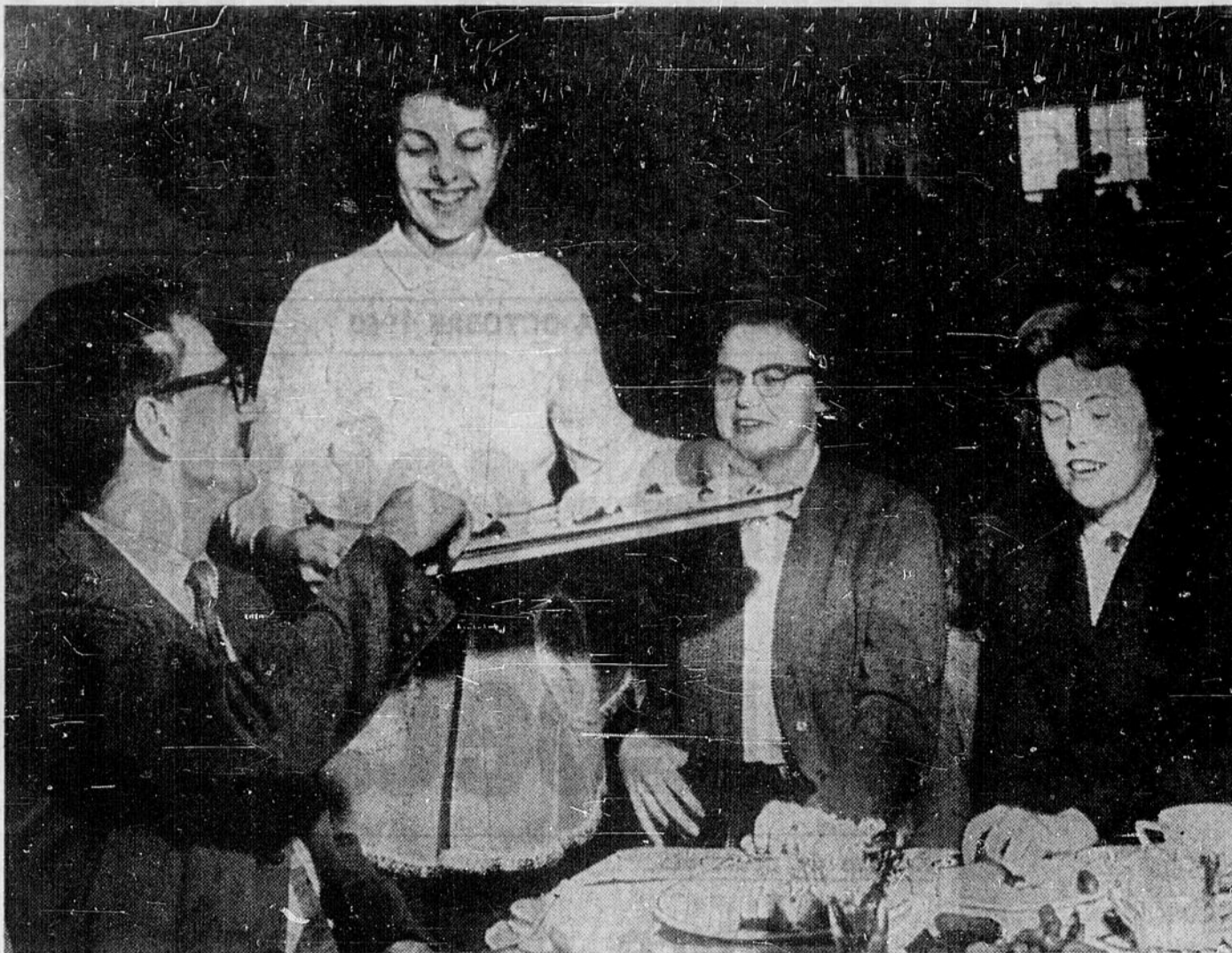
FESTIVAL DE FRAISES — Le festival de fraises annuel organisé par l'API de l'école Saint-Paul fut une très belle réussite. Plus de 400 personnes, élèves, parents, instituteurs et institutrices, et amis y ont participé. Nous voyons ici une jeune demoiselle en train de servir une table. De gauche à