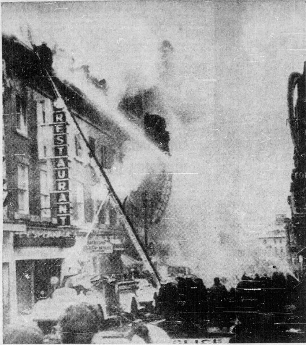
CONFLAGRATION A QUEBEC — Environ 200 personnes ont dû fuir leurs logis lors qu'un incendie a ravagé plusieurs établissements commerciaux, sur la rue St-Jean à Québec, samedi. Plusieurs pompiers ont été

blessés en combattant l'élément. Les pertes matérielles se chiffrent par environ un million de dollars. Cet incendie a donné lieu à plusieurs sauvetages.