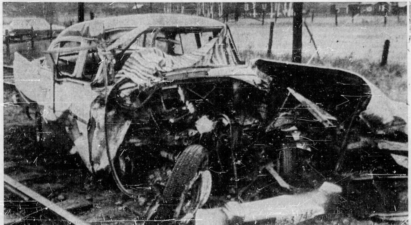
HEURTEE PAR UN TRAIN — Trois personnes reposent dans un état précaire à l'hôpital après que leur automobile eut été heurtée par un convoi de marchandises du National-Canadien. L'accident est survenu samedi midi sur la route 537 près de Wauamp, au passage à niveau de St-Cloud, à 18 milles au sud de Sudbury.