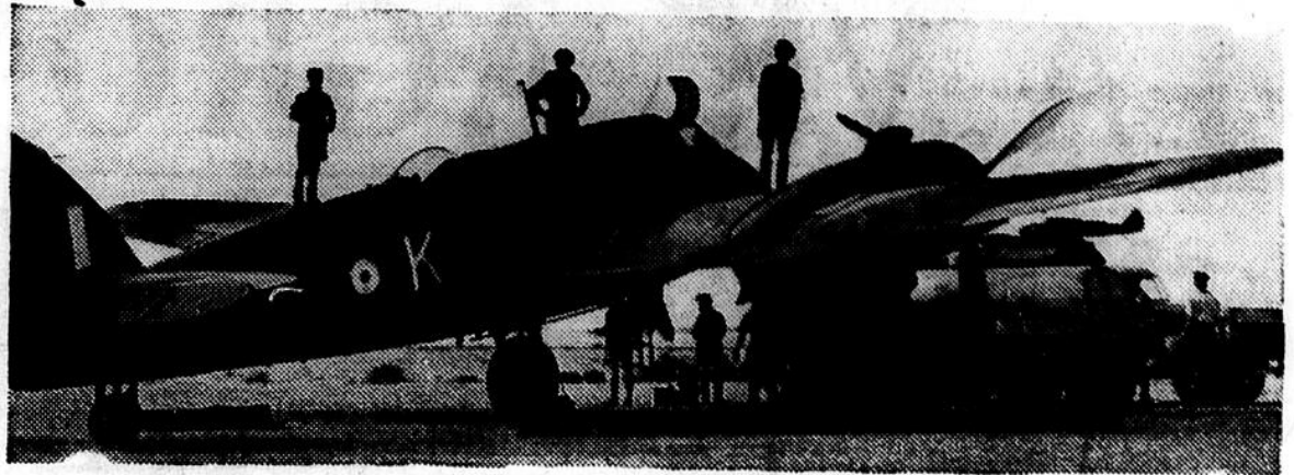
La R. A. F. a accompli des prodiges en Libye. Les magnifiques Bristol Beaufighters, dont on voit un exemplaire sur cette photo, ont contribué grandement à nous donner la supériorité de l'air en Afrique du Nord. Ces appareils de chasse sont des instruments dociles aux mains des vaillants pilotes de la R. A. F., dont plusieurs sont Canadiens. Visée par la Censure.

Enlevez ensuite le noyau de valve et laissez échapper l'air jusqu'à ce que vous puissiez étendre la chambre à air à plat en demi-cercle, sans rides ni plis. Vous devriez laisser à peu près un quart de pouce d'air dans la chambre à air pour maintenir les bords un peu arrondis. Pliez ensuite la chambre à air en 1/4 de cercle et enveloppez-la dans du papier sans la presser. Placez-la