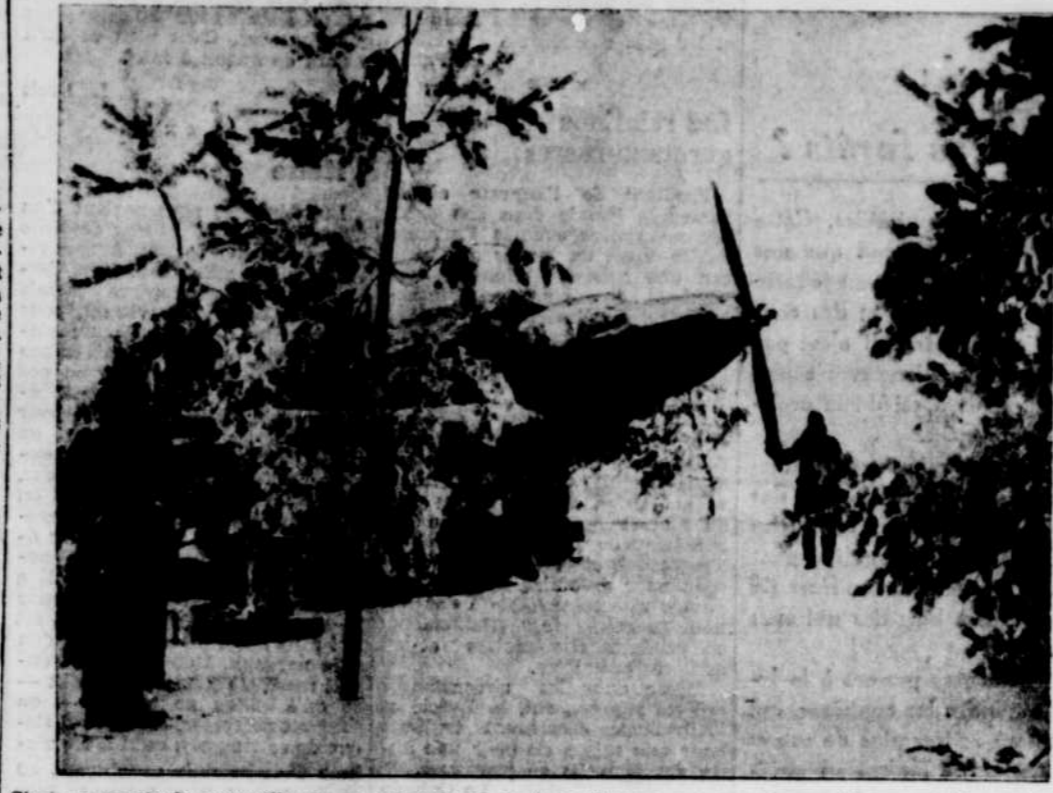
C'est un spectacle merveilleux, choqué quelque part en France, que ce paysage d'hiver, où l'on voit des pilotes de la Royal Air Force, émergeant leur sur veillance sur un avion britannique quelque part sur le front ouest. Le moteur de l'avion est caché sous des toiles, pour le protéger contre la neige et le froid qui immobilisent l'aviation des Alliés et celle de l'Allemagne et interrompent temporairement les activités aériennes. La neige, sur la partie supérieure de l'avion, sert de camouflage et attire pas les regards, dans les environs.

Ottawa, 22. (P.C.) — Le ministre fédéral des Finances, le colonel Ralston et les représentants des gouvernements alliés et de neuf provinces du Dominion ont remercié hier soir le peuple canadien de son effort du premier emprunt national de guerre lequel a remporté un éclatant succès.