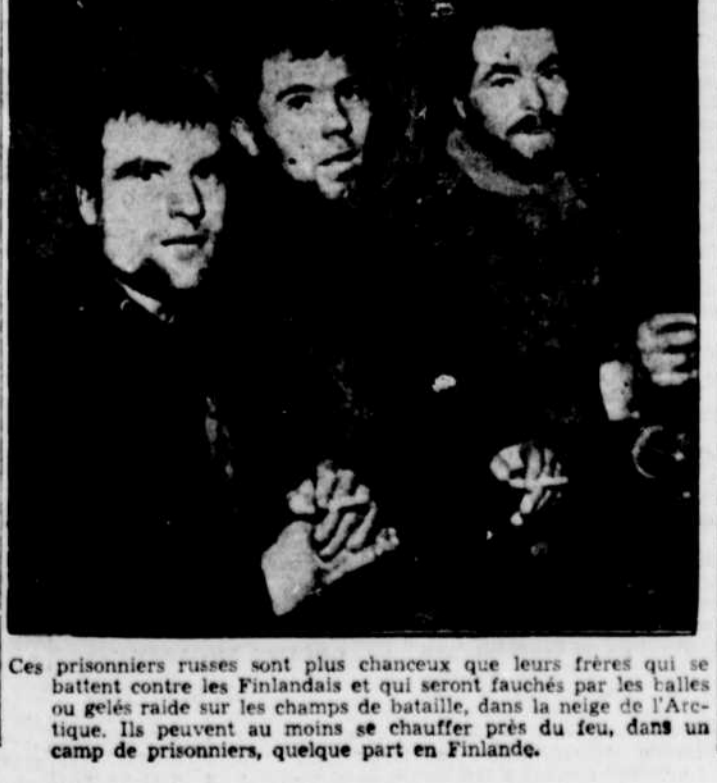
Ces prisonniers russes sont plus chanceux que leurs frères qui se battent contre les Finlandais et qui seront fauchés par les balles ou gelés raide sur les champs de bataille, dans la neige de l'Arctique. Ils peuvent au moins se chauffer près du feu, dans un camp de prisonniers, quelque part en Finlande.