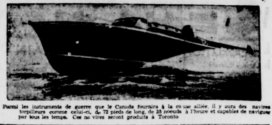
Parmi les instruments de guerre que le Canada fournira à la cause alliée, il y aura des navires torpilleurs comme celui-ci, de 72 pieds de long, de 35 nœuds à l'heure et capables de naviguer par tous les temps. Ces navires seront produits à Toronto.