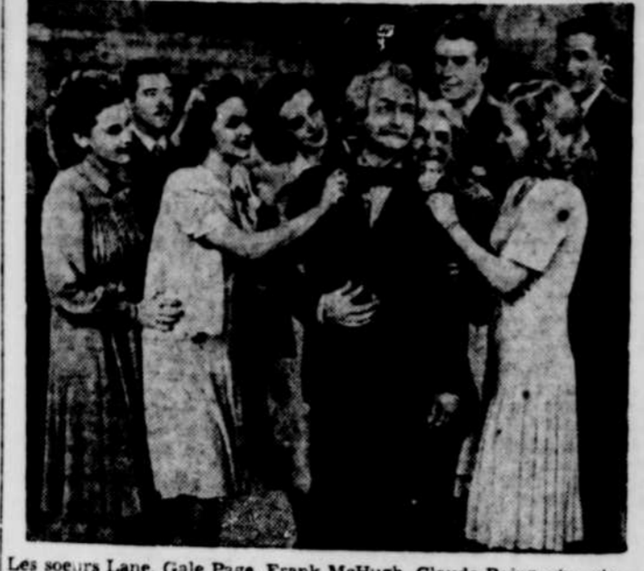
Les sœurs Lane, Gale Page, Frank McHugh, Claude Rains, etc., etc., dans "FOUR WIVES" la magistrale suite de "Four Daughters" qui tient pour jusqu'à mercredi soir l'affiche du théâtre Imperial.