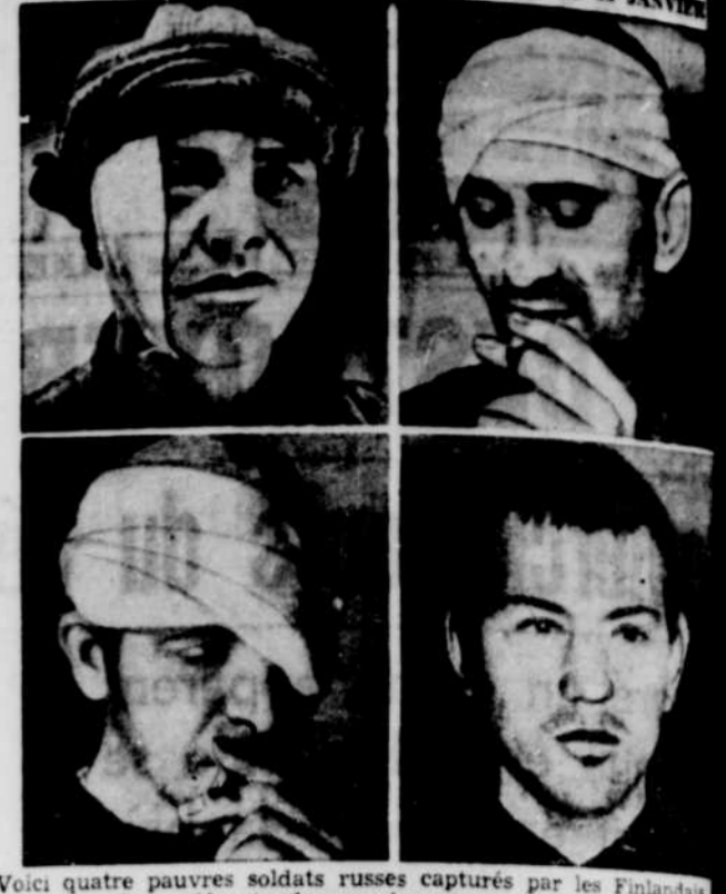
Voici quatre pauvres soldats russes capturés par les Finlandais. L'Union Nationale catholique des plombiers à huit heures.