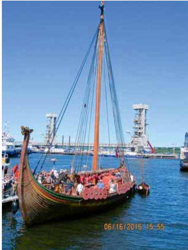
Le Draken Harald Harfagre est un drakkar authentique bâti selon un modèle du 8e siècle pour commémorer la première expédition de Leif Eriksson il y a plus de 1000 ans. Ses dimensions sont impressionnantes pour l'époque: une longueur de 35 m, une largeur de 8 m, un mât en chêne de 24 m, une voile de 260 m carrés et 24 paires de rames. Les rames étaient installées par les ouvertures circulaires sous les boucliers / The Draken Harald Harfagre is an authentic Viking ship built according to a model from the 8th century to commemorate the first Viking expedition to North America led by Leif Eriksson more than 1000 years ago. Its dimensions are impressive for the period: a length of 35 m, a beam of 8 m, a 24 m tall oak mast, a sail 200 sq. m in area, and 24 pairs of oars. The oars are installed in circular openings below shields.

barques appelées drakkars. C'étaient des guerriers redoutables semant la terreur qui amassaient surtout de l'or, des objets précieux, du bétail et des esclaves. Ils ciblaient de préférence les villes épiscopales et les grandes et riches abbayes.