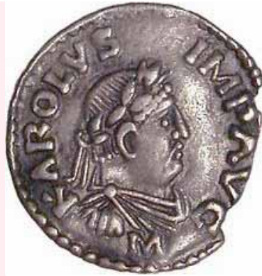
Denier impérial en argent de Charlemagne, inspiré des modèles romains. / Imperial silver denarius of Charlemagne, inspired by Roman models. C'est en l'honneur de ce Charlemagne que tous les écoliers chantent: « Qui a eu cette idée folle, un jour d'inventer l'école, c'est ce sacré Charlemagne. »