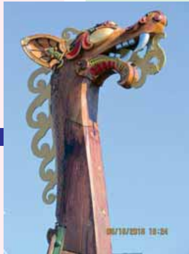
La figure de proue avec une tête d'animal mythique pour braver les tempêtes, mais aussi pour peut-être apeurer les ennemis. / The figurehead is of a mythical animal to help the ship brave the storms, but perhaps also to arouse fear in enemies.

To summarize, no tangible proof of the existence of the name Hesdin before the year 1000 has been discovered. It isn't until the next century that we see that name appear with an actual line of counts of Hesdin.