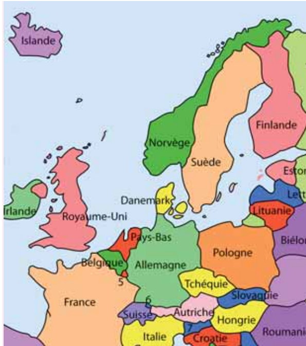
Carte d'une partie de l'Europe et la Scandinavie qui comprend le Danemark, la Suède, la Norvège et la Finlande.

transférées plus loin à l'intérieur des terres pour les mettre à l'abri.