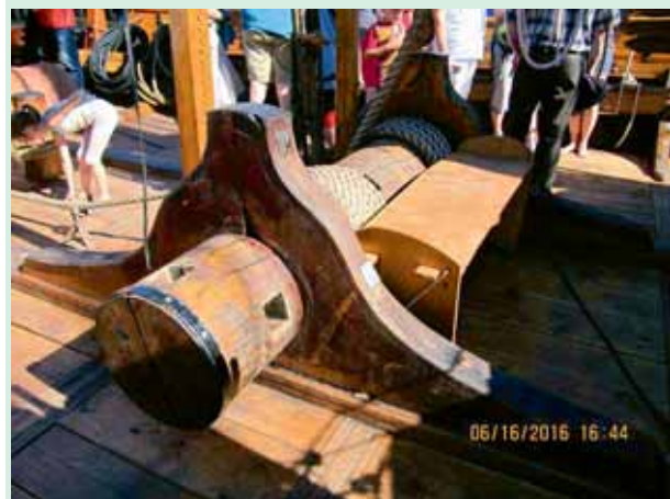
Le treuil en bois et les cordes goudronnées en chanvre pour manier la seule grande voile utilisée / The wooden winch and lines of tarred hemp were used to maneuver the one large sail that was used.

The Vikings, and the Normans who were related to them, have a poor reputation because of their pillaging; however, they had a well-organized civilization that practised agriculture and livestock