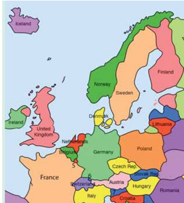
Map of a portion of Europe and Scandinavia including Denmark, Sweden, Norway, and Finland.

Les Vikings, et les Normands qui leur sont apparentés, ont mauvaise réputation à cause de leurs pillages, mais ils formaient une civilisation très bien organisée qui pratiquait l'agriculture et l'élevage. Ils étaient regroupés en villages avec des lois et règlements. Le Musée canadien de l'histoire à Gatineau a tenu une exposition au printemps 2016 sur leur mode de vie qui les protégeait du froid. C'étaient de grands navigateurs qui venaient à Terre-Neuve pêcher la morue et chasser la baleine bien avant que Jacques Cartier et Christophe Colomb aient côtoyé l'Amérique. Ayant voyagé jusqu'aux Indes via les cours d'eau, ils ont importé des inventions avant-gardistes en Occident. Ils avaient appris à faire fondre le fer à une température supérieure à 1500 degrés Celsius et à fabriquer de l'acier extrêmement résistant selon une formulation secrète. Les épées des officiers portaient la griffe du fabricant, leur légèreté et résistance apportaient un avantage certain lors des batailles.