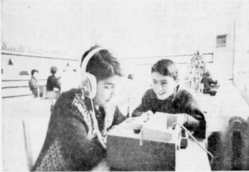
Le ruban magnétique, un instrument indispensable à l'étude des langues.