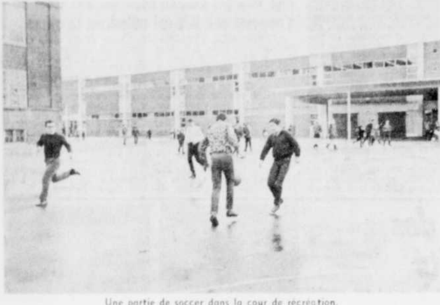
Une partie de soccer dans la cour de récréation.