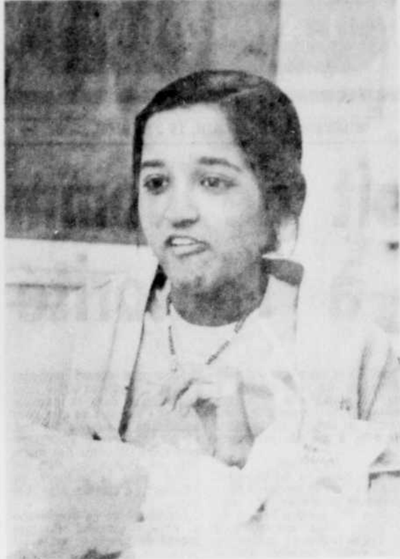
Jeune et jolie Asiatique à l'heure du lunch à la cafétéria de l'école.