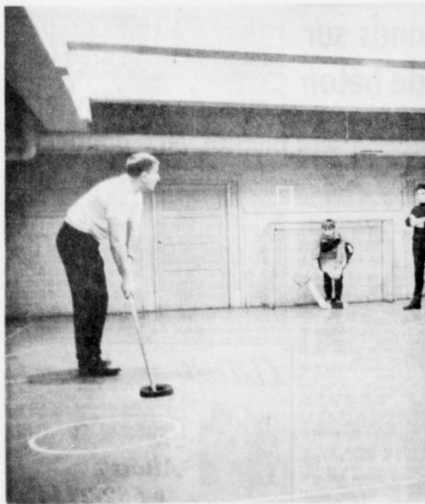
Le jeu aide à apprendre les langues. C'est ici une leçon de hockey sur plancher.