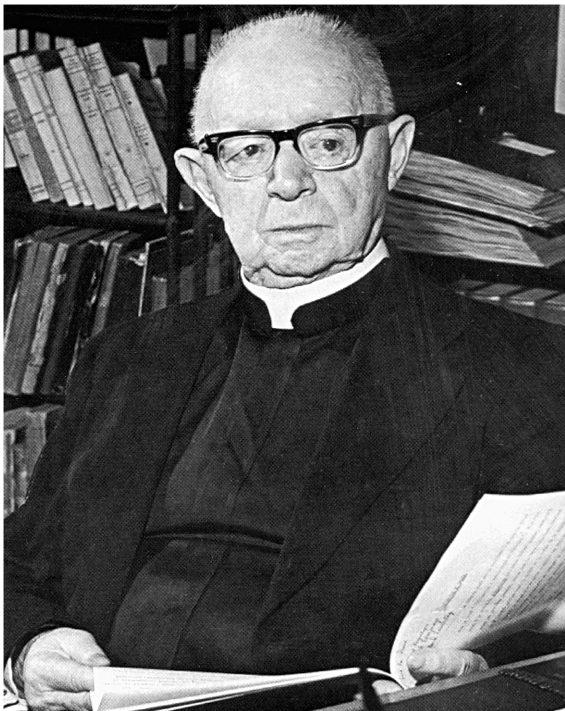
Le chanoine Lionel Groulx sentit le besoin de réhabiliter les Patriotes aux yeux de la droite catholique en les faisant paraître moins libéraux et anticléricaux qu'ils n'étaient.

Après quoi, le professeur et historien passe à la description sommaire de quelques ouvrages dont les idées marqueront les générations futures. Il y a la plaquette de Stanley B. Ryerson, membre du Parti communiste du Canada, parue en 1937 dans l'indifférence et intitulée The Birth of Canadian Democracy : « Il fut prof érémite d'histoire à l'UQAM et il a eu une immense influence à partir des années 1964-65 sur la formation de nos historiens de gauche au Québec. Cette brochure, avec le temps, aura une influence colossale sur les intellectuels de gauche lors de la Révolution tranquille et sur le FLQ par la suite. C'est là qu'on voit que, dans ces années 1930, sont plantés des jalons d'idées qui vont ressurgir plus tard: le FLQ va puiser à tour de bras là-dedans. »