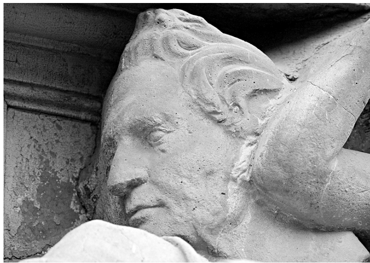
Haut-relief représentant Louis-Joseph Papineau sur une façade de la rue Saint-Denis, à Montréal

En 1834, le Parti patriote, qui conserve la majorité des sièges à l'Assemblée législative élue, est las de se buter à l'administration coloniale locale qui ne veut rien entendre. Les députés votent les fameuses 92 résolutions, fer de lance dans cette quête de reconnaissance, et non d'indépendance. Ces doléances adressées directement au gouvernement britannique seront, trois ans plus tard, balayées du revers de la main par les résolutions Russel, qu'Yvan Lamonde résume à «10 non». Le ton monte, l'ambiance de-