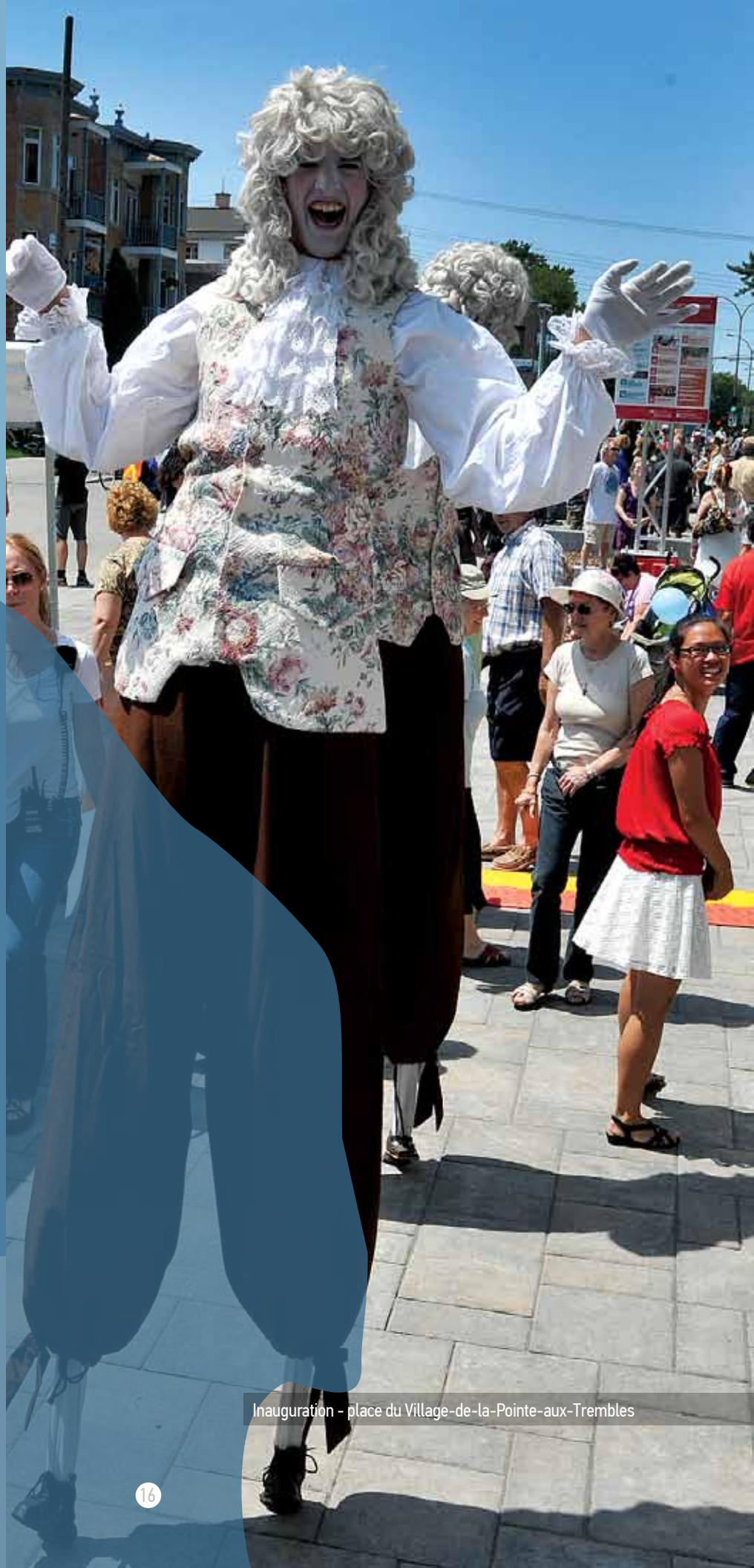
Inauguration - place du Village-de-la-Pointe-aux-Trembles