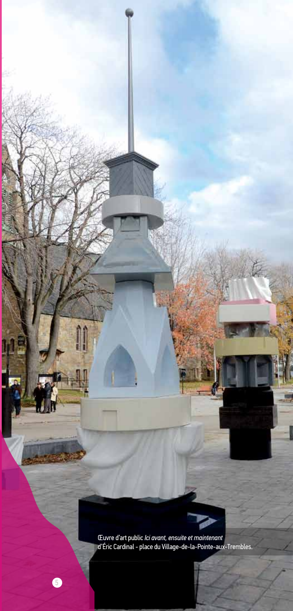
Œuvre d'art public Ici avant, ensuite et maintenant d'Éric Cardinal - place du Village-de-la-Pointe-aux-Trembles.