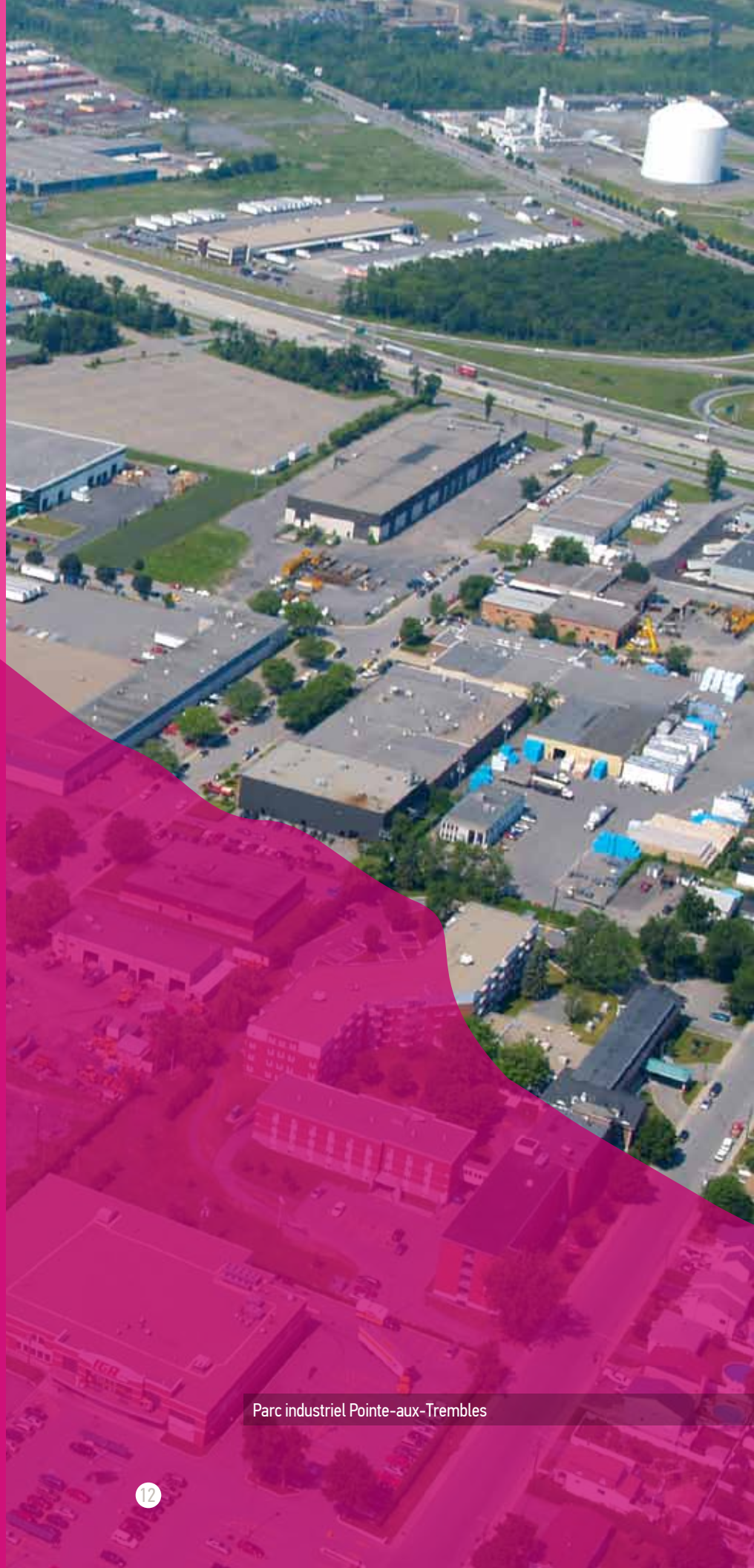
Parc industriel Pointe-aux-Trembles