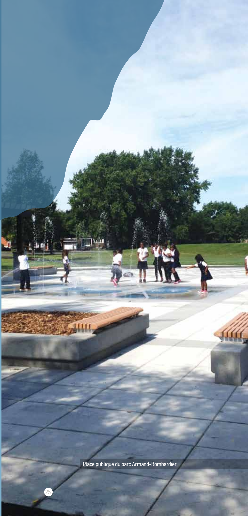
Place publique du parc Armand-Bombardier