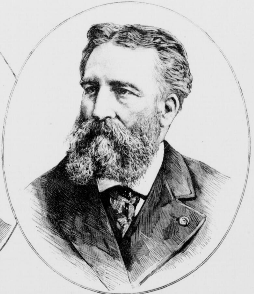
M. POUBELLE, PRÉFET DU DÉPARTEMENT DE LA SEINE