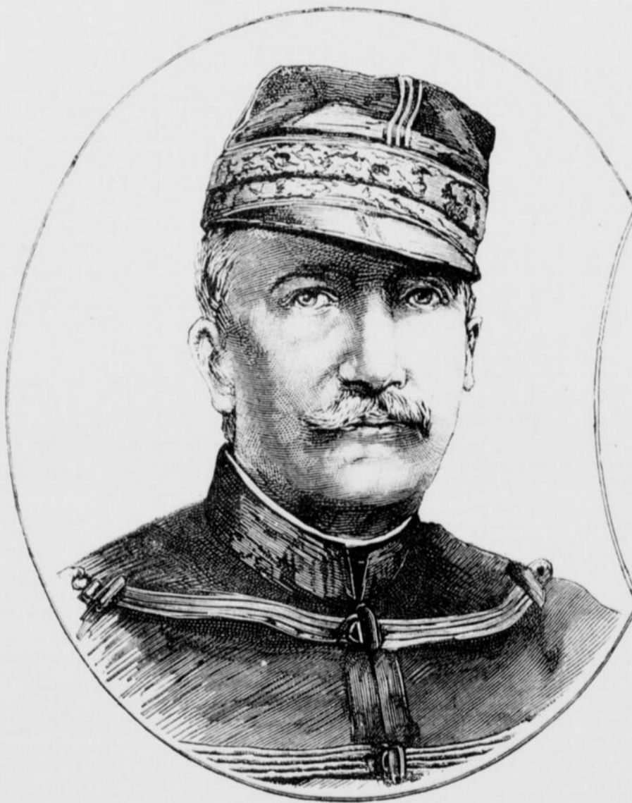
LE GÉNÉRAL CAMPENON, MINISTRE DE LA GUERRE