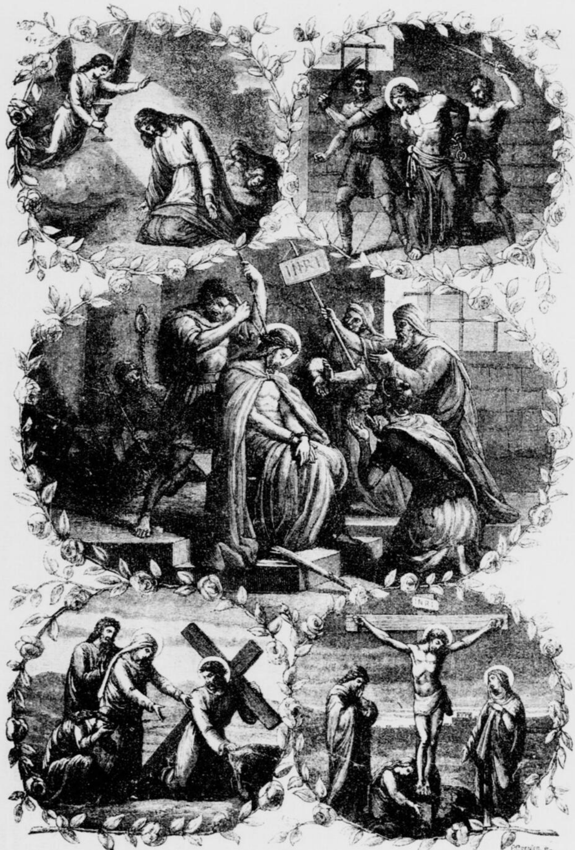
Le règne de Jésus-Christ dans la douleur, préparé dans l'agonie de Gethsemani et dans la flagellation, proclamé par le couronnement d'épines; achevé dans le chemin de la Croix et le Crucifiement.