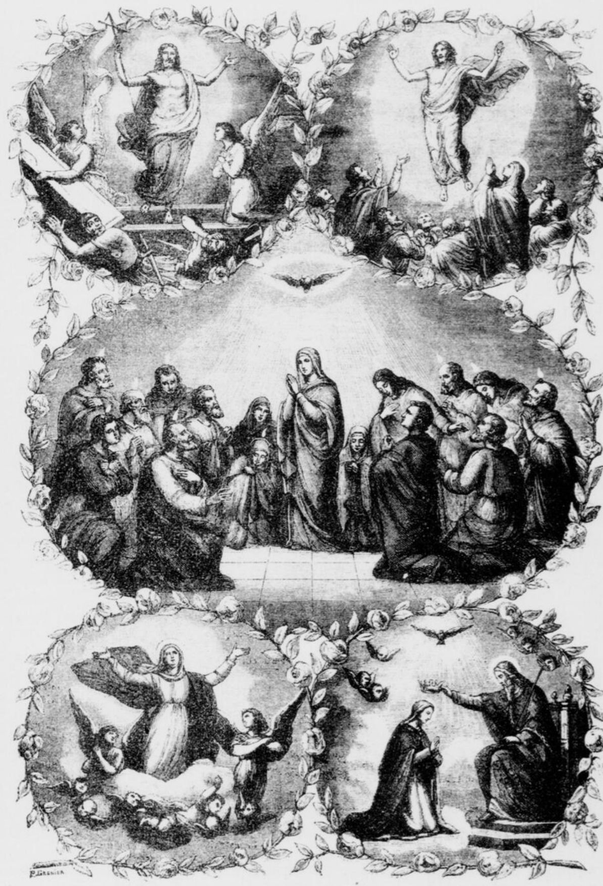
Le Règne glorieux de Jésus-Christ préparé par la Résurrection et l'Ascension du Sauveur réalisé sur la terre au jour de la Pentecôte, consommé au ciel par l'Assomption et le Couronnement de Marie.