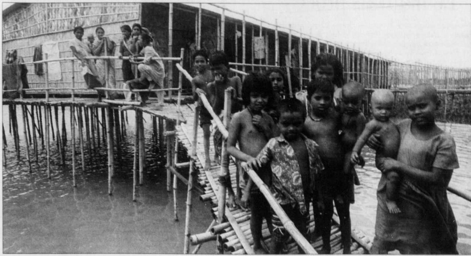
C'est au Bangladesh qu'est né le micro-crédit.

Pas étonnant que l'électeur moyen soit de mauvais poil!