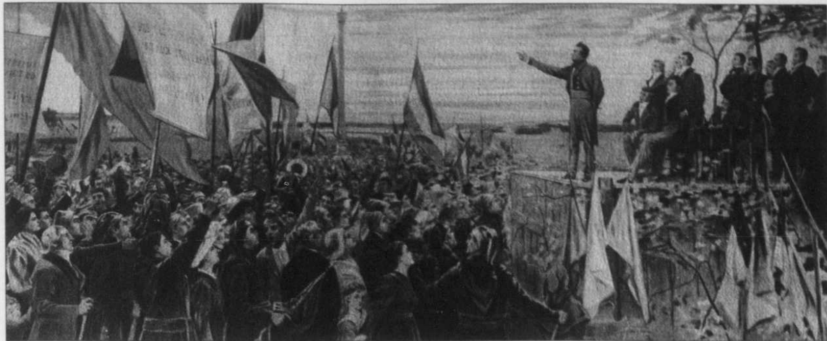
Œuvre Hommage aux patriotes 1837-1838.