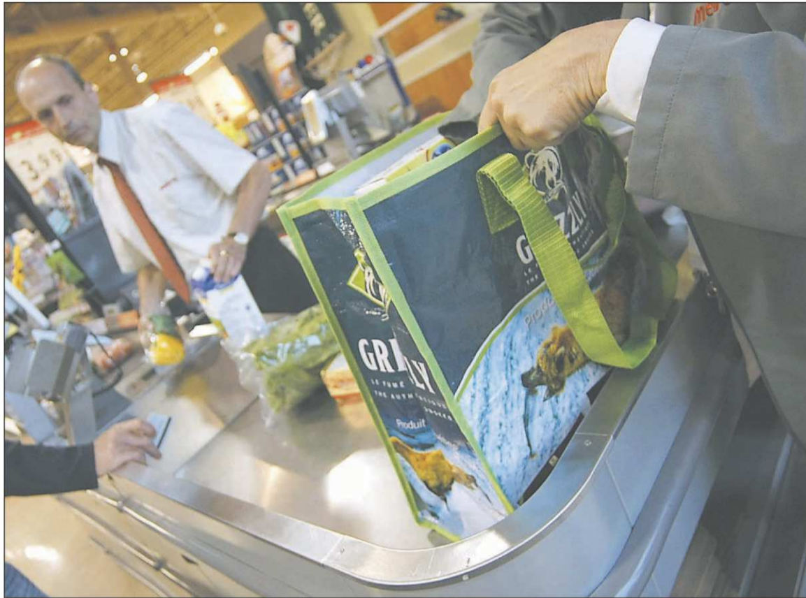
LE SOLEIL, LAETITIA DECONINCK

L'analyse de 25 sacs, dont 23 récupérés auprès de consommateurs, a révélé que les deux tiers présentaient des