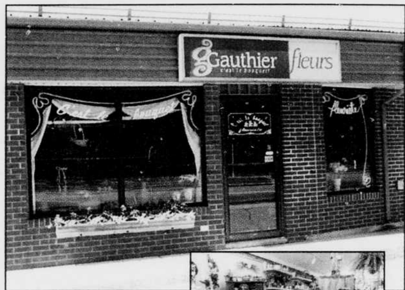
La boutique Gauthier C'est le bouquet sur le boulevard des Récollets à Trois-Rivières.