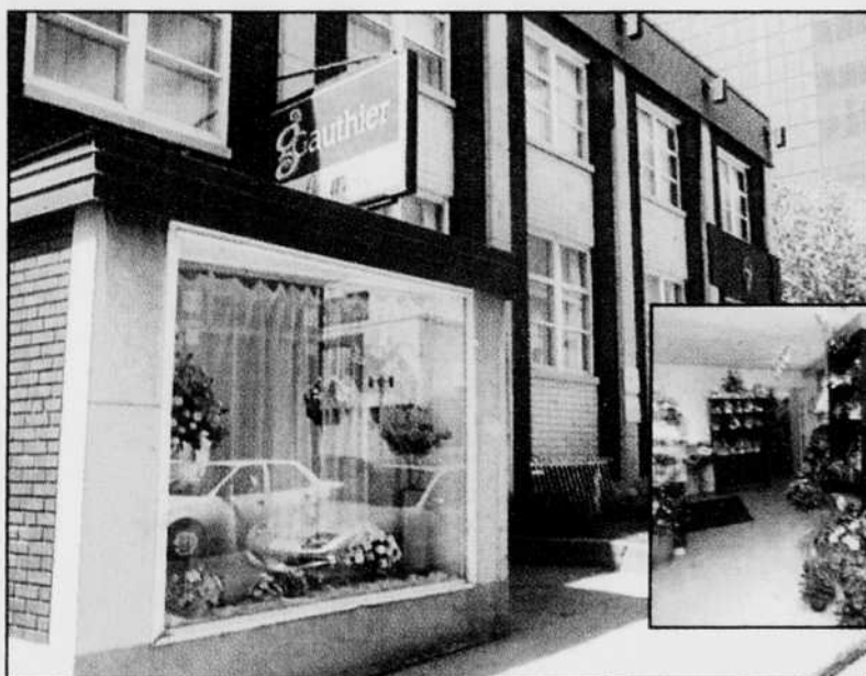
La succursale Gauthier centre-ville sur la rue Royale à Trois-Rivières.

tre de jardinage et les bureaux administratifs. Cette nouvelle construction vient s'annexer à la boutique de fleuriste déjà existante. De plus, trois nouvelles serres se sont ajoutées aux installations portant le total à cinq, dont trois chauffées.