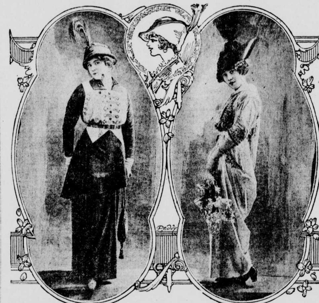
Les costumes d'un seul morceau sont aussi populaires qu'e jamais. Nous en illustrons deux jolis modèles. L'un est en soie, l'autre en duvetine.

Volonté et tenace que l'opinion et la contradiction rendent un peu agressive. C'est en résumé un homme supérieur qui a conscience de sa valeur, n'en tire pas de vanité mais de l'assurance et de la confiance en lui.