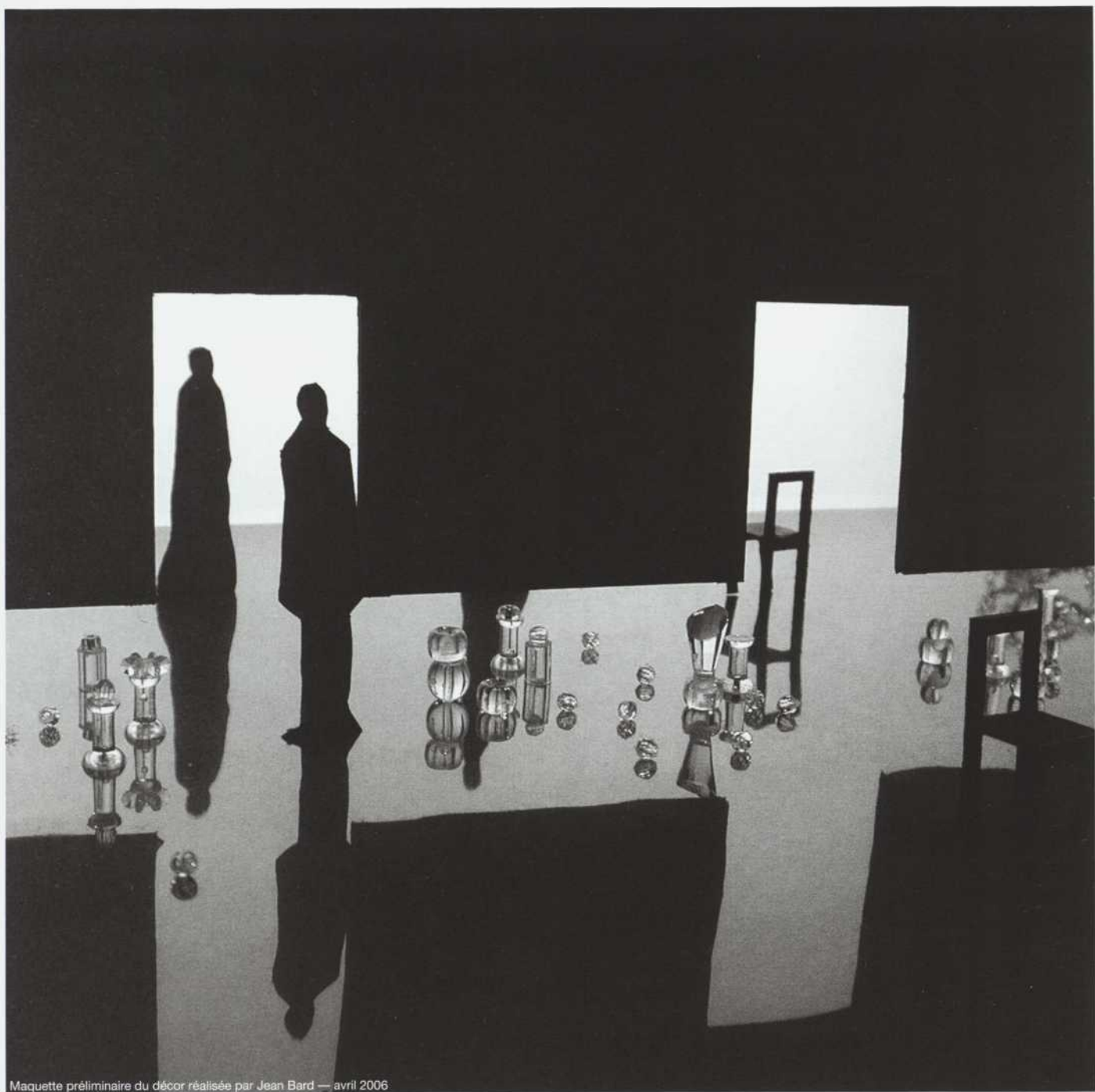
Maquette préliminaire du décor réalisée par Jean Bard — avril 2006