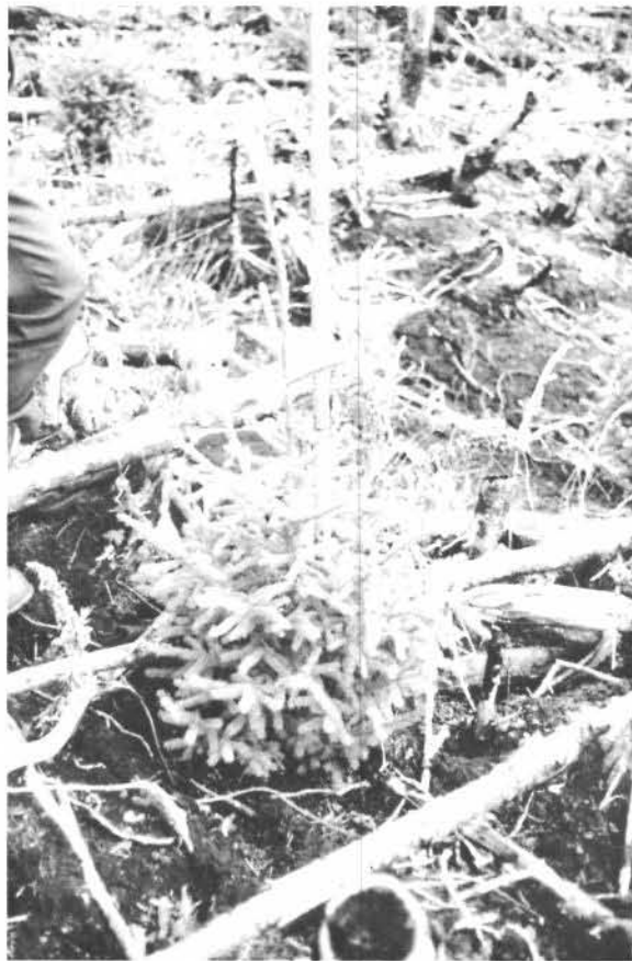
Figure 3. Après cinq ans, certains arbres atteignent plus d'un mètre en hauteur