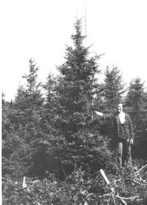
Figure 4. En 1979, les arbres dominants et co-dominants atteignent facilement 4,0 mètres