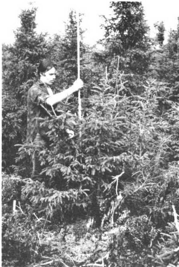
Figure 2. Arbre endommagé, 15 ans après la plantation