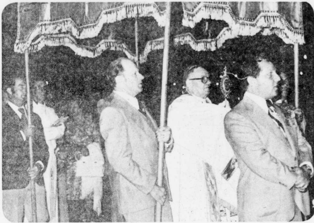
Mgr Georges-Léon Pelletier, fidèle à son habitude, s'était rendu célébrer la fête de sainte Anne avec la population de Yamachiche.

Pour toutes ces raisons, le tribunal a prononcé la nullité de la clause de non-concurrence signée en juin 1971 et a rejeté l'action en injonction per- manente de la demanderesse, avec dépens, en réservant toutefois à celle- ci tous ses droits et recours en dom- mages contre le défendeur, s'il y a lieu.