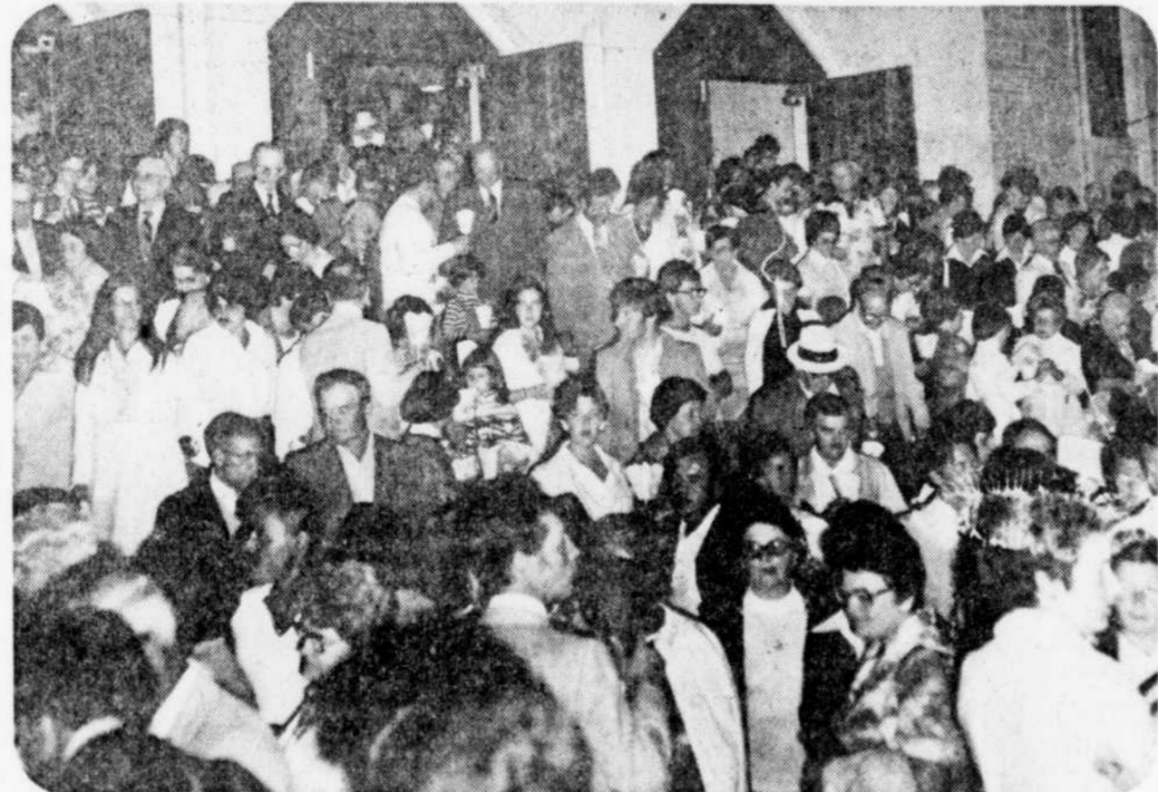
Au sortir de la messe au moment où la procession qui conduira la foule à la statue de sainte Anne, va se mettre en branle. Environ 1,500 personnes s'étaient massées à l'intérieur de l'église pour la messe alors que quelques centaines d'autres se trouvaient dehors.

Répondant avec enthousiasme à l'ap- pel des organisateurs de la fête de leur patronne, les citoyens avaient pavoi- sé en grand nombre ce qui donnait un vé- ritable air de fête au coeur du village, par- ticulièrement au moment de la pro- cession aux flambeaux qui suivait la messe chantée par Mgr Georges-Léon Pelletier assisté d'un dizaine de prêtres, dont quelques fils de la paroisse.